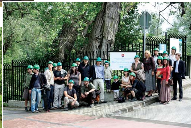
Účastníci slávnostného vyhlásenia chráneného územia sa na záver exkurzie prešli tunelom popod rameno Dunaja

členských krajinách EÚ a ktorej hlavným cieľom je zachovanie najcennejších prírodných biotopov a najviac ohrozených druhov rastlín a živočíchov.