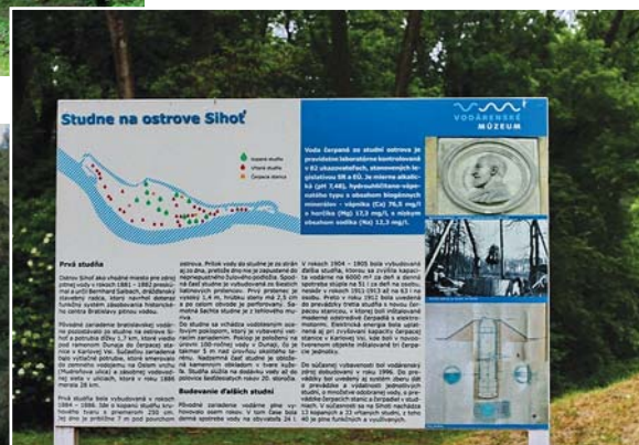
Mapka informuje o výskyte 13 kopyaných a 33 vrtaných studní