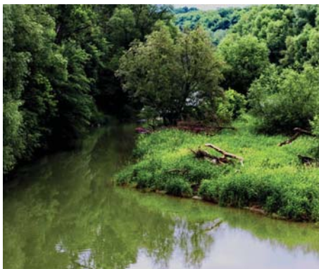
Karloveské rameno obtekajúce ostrov Sihoť, súčasne posledné voľne tečúce rameno Dunaja na Slovensku