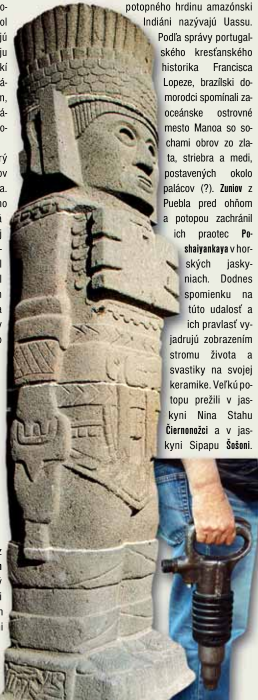
Náhodná podobnosť nástrojov

Kolumbie takto priplával hrdinský Nemquetheba/Nemtherqueteba. V Britskej Guyane to bol Macusis, v Paraguayi Lume/Zume a v Patagónii Zeu-kha. Praotec brazílskych Indiánov Wai-Tepu (Slnčná hora) priplával s rodinou z ostrova zničeného ohňom a zaliatego potopou. Na východobrazílskom pobreží svojho predpotopného hrdinu amazónski Indiáni nazývajú Uassu.