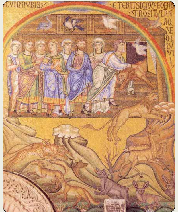
Mozaika o skončení Veľkej potopy z Baziliky sv. Marka v Benátkach