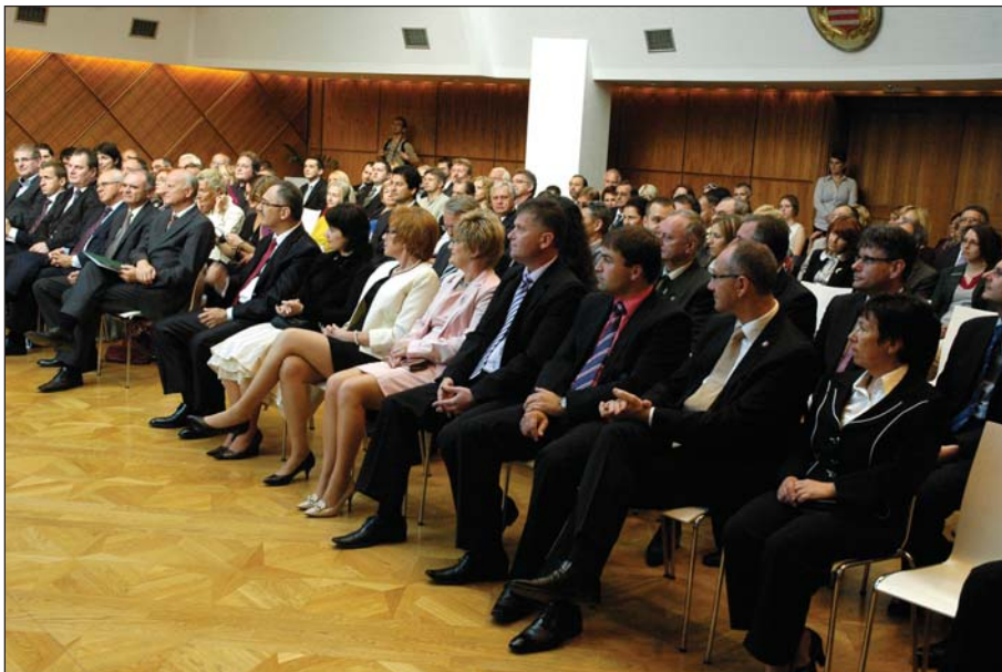
Slávnostné odovzdávanie cien prebehlo v Cikkerovej sále Radnice v Banskej Bystrici