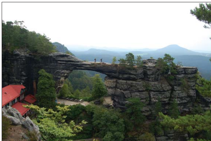
Český film Kamene v pohybe porota zaujal inovatívnou metódou, objasňujúcou milión rokov starú históriu vzniku krajiny České Švajčiarsko