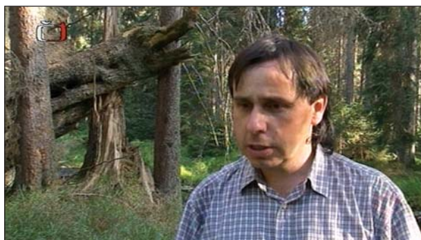
V kategórii Spravodajské a publicistické filmy bol úspešný český film Rozprávanie o lese

V kategórii Dokumentárne filmy sa porotcovia zhodli na tom, že cena putuje do Poľska režisérovi filmu Medveď pán karpatských lesov za úžasné dokumentárne pozorovanie, za príbeh, ktorý udrží diváka v napätí od začiatku až do konca.