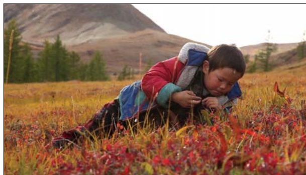
Ruský film Dych tundry vyhodnotila odborná porota ako najlepší film pre deti a mládež

Medzi Vzdelávacími a náučnými videoprogramami a filmami „zabodoval“ český film Kamene v pohybe za jeho unikátnu a inovatívnou metódou, objasňujúcou milión rokov starú históriu, ako zrno obyčajného piesku vytvorilo České Švajčiarsko.