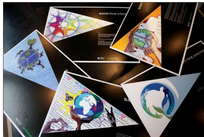
Vlajky pre budúcnosť - ukážky návrhov medzinárodnej súťaže