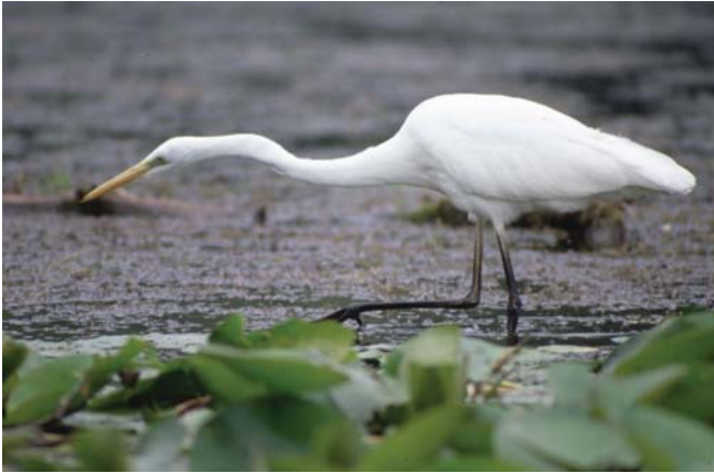
Volavka biela (Egretta alba)

• vyhlásenia predmetných chránených území zabezpečujú krajské úrady životného prostredia a postupujú pritom podľa § 50 zákona o ochrane prírody a krajiny. Vyhláškami z roku 2009 sa už stali súčasťou národnej sústavy chránených území ÚEV Kobela a Cúdeninský močiar vyhlásené za prírodné rezervácie a ÚEV Pavúkov jarok, Konopiská, Čiližské močiare, Boršiansky les, Stretavka a Marhecké rybníky vyhlásené ako chránené areály. Zabezpečila sa tiež ochrana časti ÚEV Bratislavské luhy, keď bola v rámci jeho územia vyhlásená PR Slovanský ostrov a vyhlásila sa PR Šúr, ktorá v sebe zahŕňa ÚEV s rovnomeným názvom;