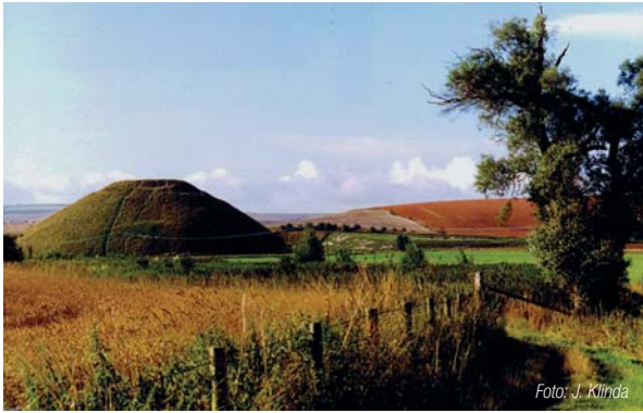
Silbury Hill v Anglicku