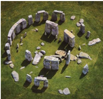
Stonehenge v Anglicku

škótskom Inverness. Vikingami vylúpenú mohyľu Maes Howe (priemer 35 m, výška 7 m) na Orknejách pri Finstowne, neďaleko kamenného kruhu Stones of Stennes (3000 prnl.) a pôvodne šesťdesiatkameňového Ring of Brodgar (dnes len 27 balvanov) vybudovali okolo roku 2750 prnl., teda v čase, keď tu už stála neolitická kamenná dedina Skara Brae z rokov 3100 – 2500 prnl. (ďalšiu Jarlshof odkryli na Shetlandoch). Mohyľy na Britských ostrovoch charakterizujú najmä Wessexskú kultúru staršej kamennej doby (1550 prnl.), ku ktorej sa zaraďujú mohyly v Hove pri Brightone, v Edmondshame v Dorsete, Earls Barton pri Northampton. Lochhamský mohylník zo začiatku strednej bronzovej doby obsahuje 11 mohýľ o priemere 6 – 15,5 m, avšak už len 70 cm vysokých. Z bronzovej doby pochádzajú aj hrobové mohyly Bush Barrow a Brenig. K najstarším anglickým mohylám patria tzv. dlhé mohyly ( long barrows ) z obdobia 3400 až 2500 prnl., ktoré dosahujú dĺžku 30 – 60 m, šírku 12 m a výšku 4 – 5 m. Najväčšie v Európe pochádzajú z lokality West Kennet Barrow. Okrem južného Anglicka sa vy-