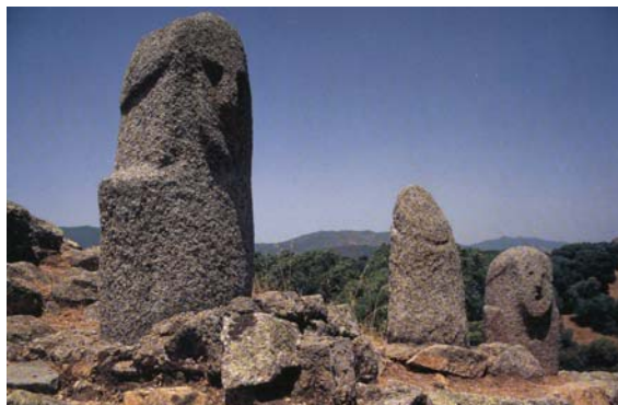
Filitosa na Korzike