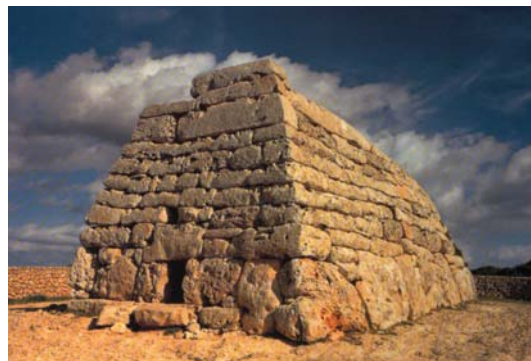
Naveta d' es Tudons na ostrove Menorca