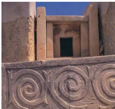
Tarxien na Malte