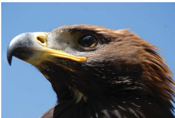
Vták poranený strelou do krídla, nájdený vysilený v prírode...

potom pocit krásna je u takéhoto človeka zanesený nánosmi nezdoľnej vášne, ktorá mu nedovoľuje vyjsť na povrch. Lútosť nad vzatím života zvieratá musí na miskách váh zreteľne prevážiť nad vášňou po poľovníckom zážitku či trofeji. Ak tomu tak nie je, potom sa v nás stráca ľudská podstata, ktorou máme mať navrch nad ostatnými tvormi na planéte Zem. Kam potom ale naša ľudská pospolitosť speje...?