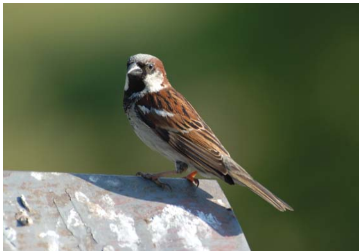
Vrabca domového väčšina ľudí považuje za škodcu, a preto nie je v obľube, hoci v čase kŕmenia mláďat hubí hmyz, a preto si zaslúži našu ochranu a pomoc

Pohľad na ručiaceho jeleňa svojsky sa dvoriaceho spoločnosti jeleníc, či na tokajúceho hlucháňa v prítomí lesa zaliateho mesačným svitom, musí uhasiť loveckú vášeň každého poľovníka. Ak tomu tak nie je a potrebuje k tomu výstrel a zhasnutie zveri,