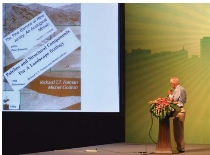
Významný svetový krajinný ekológ Richard Forman na plenárnej prednáške 8. svetového kongresu IALE