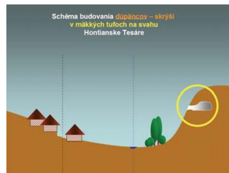
Typy skalných obydlí v Honte