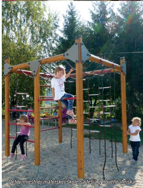
Deti v miestnej materskej škole sa tešia z nového ihriska