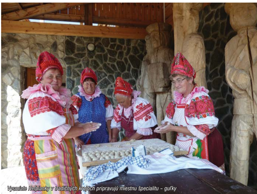
Vysmiate Heľpianky v tradičných krojoch pripravujú miestnu špecialitu – guľky