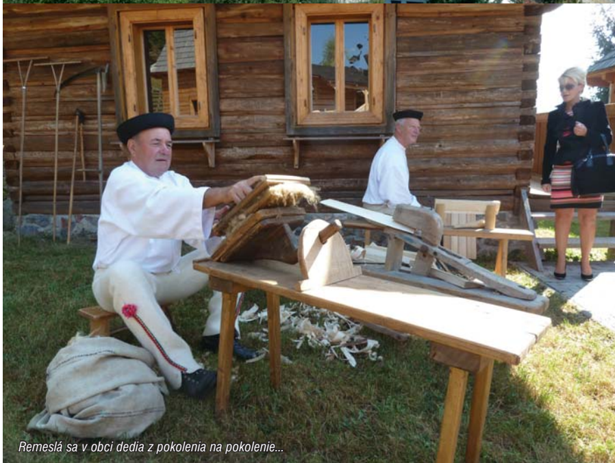
Remeslá sa v obci dedia z pokolenia na pokolenie...