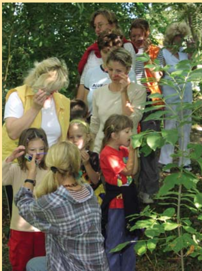
Program Envík pre rodiny s deťmi umožní zážitkové spoznávanie okolitej prírody

Lektorovaná exkurzia pre II. stupeň ZŠ a SŠ zameraná na európsku sústavu chránených území Natura 2000, naturové druhy