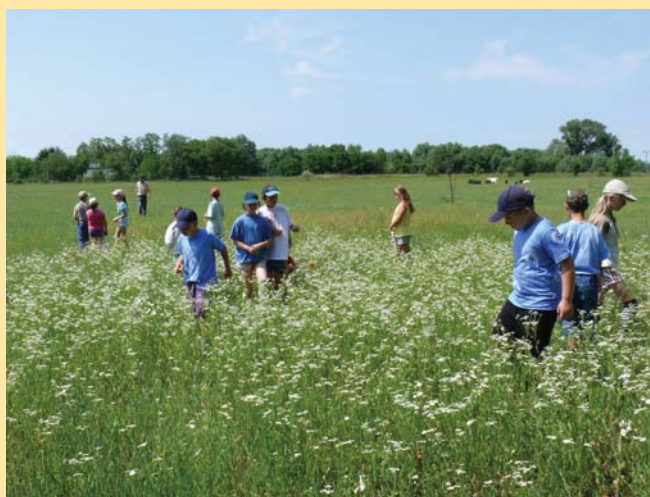
Výprava na ostrov je atraktívny trojdňový environmentálny program

Pobytové programy sú zamerané na objavovanie skrytých tajov Žitného ostrova, spoznávanie všadeprítomných mokradí a vtáčích obyvateľov, porozumenie šepotu hlavových vrúb, objavovanie tradičných materiálov a histórie ostrova. Programy môžu byť troj- alebo viacdňové.