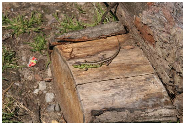
1. miesto: Jakub Kotúč (2. trieda): Modelka jašterica