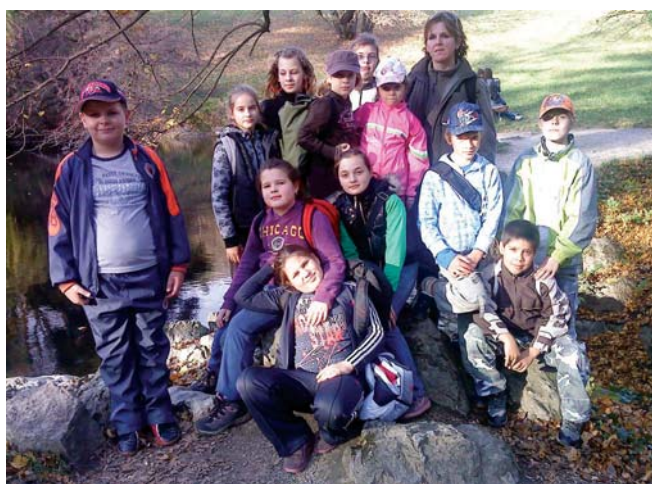
Prieskumná skupina Boričkovia z Borského Mikuláša