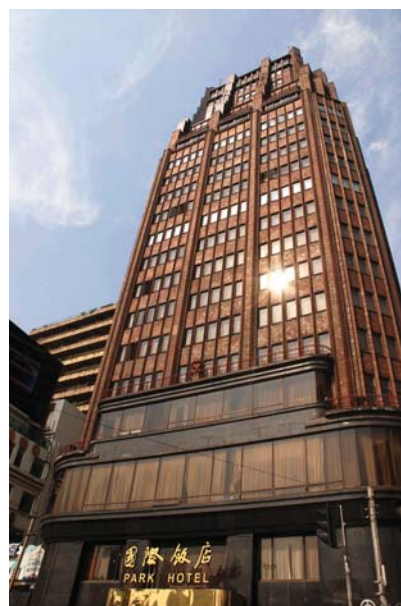
22-poschodový Park Hotel z dielne arch. L. Hudeca bol po dve desaťročia najvyššou budovou v Ázii

Toho roku si pripomíname tvorbu troch slovenských režisérov, osemdesiatnikov. Dvaja z nich – Martin Hollý (11. 8. 1931 Košice – 18. 3. 2004 Bratislava) a Otakar Krivánek (18. 9. 1931 Levoča – 1. 10. 1997 Bratislava) sú už po smrti. Tretí z nich – Eduard Grečner (21. 9. 1931 Kopčany), sa predstaví divákovi filmom Drak sa vracia (1967). Film bol nakrútený podľa novely Dobroslava Chrobáka. Divákovi ponúka baladu o láske, nenávisti a hľadaní cesty z osamelosti. V hlavnej úlohe divácividia českého herca Radovana Lukavského ako Martina Lepiša – Draka a Emíliu Vášaryovú ako Evu. Ilja Zeljenka získal za hudbu k filmu Igrica 1968. Eduard Grečner nakrútil pre kiná celovečerné filmy Každý týždeň sedem dní , Nylonový mesiac , Pozemský nepokoj , Jaškov sen a niekoľko filmov pre televíziu, napr. Čarodejnica , Mŕtve oči , Pribeľská vzbura Janka Kráľa .