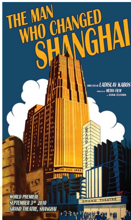
Film Zmenil tvár Šanghaja bol premiérovou uvedený 3. septembra na Expo Šanghaj 2010 (na snímke plagát k tejto udalosti)