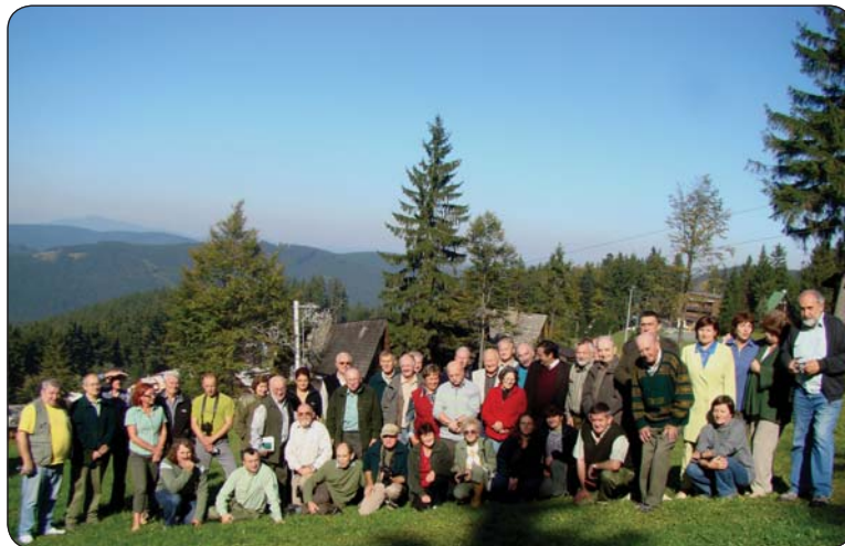
Účastníci XVI. ročníka stretnutia seniorov ochrany prírody Slovenska