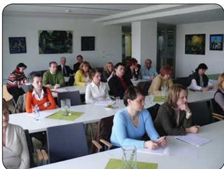
Auditórium informačného dňa v Trnave

Kancelárie REPIS (Regionálne environmentálne poradenské a informačné strediská) fungujú ako centrá prvého kontaktu od roku 2004 pre potencionálnych žiadateľov v rámci Operačného programu Životné prostredie (OP ŽP) v Slovenskej agentúre životného prostredia.