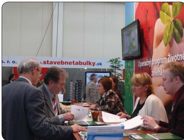
Pracovníci REPIS na výstave CONECO Bratislava 2010

Pri organizovaní informačných dní naši pracovníci spolupracovali s Úradom