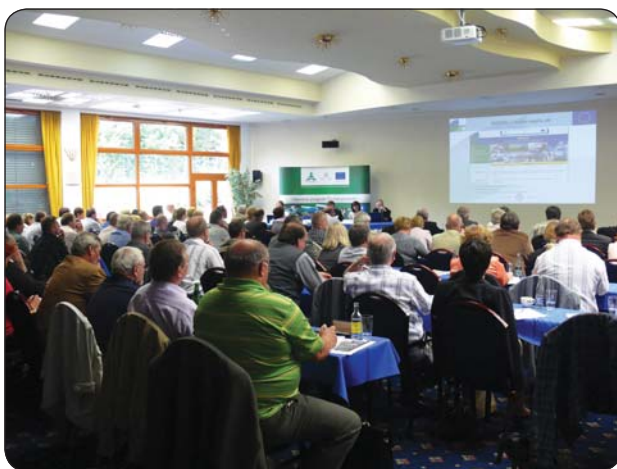
Infodni sú osvedčenou formou informovania žiadateľov o nenávratný finančný prostriedok

Pracovníci REPIS poskytovali informácie aj prostredníctvom informačného portálu www.repis.sk , ktorý je aktívne prepojený na informačný portál pre OP ŽP www.opzp.sk . Na tomto portáli sú všetkým užívateľom sprístupnené aktuálne informácie týkajúce sa prípravy,