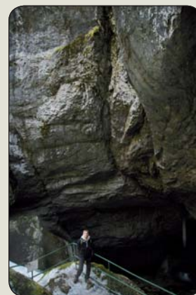
Kultová Silická ľadnica

Domici alebo neďaleká Silická ľadnica). Posvätný kráter Koko na havajskom ostrove Oahu považovali domorodci za odtlačok vagíny bohyne Kapo. Za orakulum sa považoval aj posvätný vrch Etruskov – Montovolo i libanonský Baalbek.