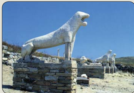
Na ostrove Délos

(očami) významných egyptských, gréckych, rímskych a iných bohov (bohovia nikdy neboli pre všetkých, a keď išlo o spoločný kšeft, ani nesúperili) a ich vyznávačov; veriacich nákupcov otrokov, otrokárov a kupcov/vlastníkov otrokov za ich „zločiny“ vopred omilostili. Rozhrešenie tu asi našepkával Délsky omfalos ozdobený reliéfom hada („rajský“ had našepkáva hriechy otrokárom a ďalším násilníkom dodnes a bohovia sú k nim naďalej milostiví, dokonca neraz na ich podnet trestajú „nevinných otrokov“). Delphský omfalos pôvodne patril bohyni (mat-