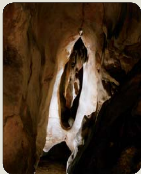
Lono Matky Zeme v Domici