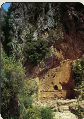
Prameň Catalia - pôsobisko Pýthie v Delfách

a domestikovať niektoré z nich. Jeho syn Sijomak/Sijámak bojoval neúspešne proti zlým daévom (zlým démonom = játu ) a vnuk - chrabrý praotec Árijcov Húšang/Haošjanh, objaviteľ/udržiavateľ ohňa a prvý zákonodarca ( péš-dád ), aj proti Čiernemu šarkanovi.