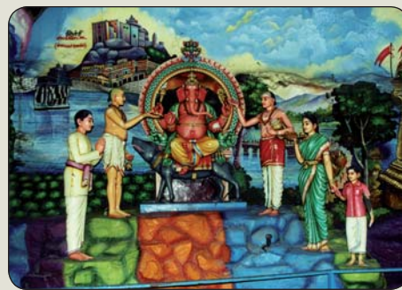
Ganéša v malajskej jaskyni Batu