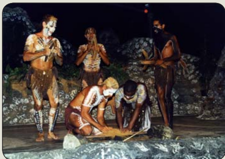
Tradičné zažihanie ohňa v austrálskom Queenslande

V Sumeri božským vládcom pôvodnej krajiny – environmentu suchozemských organizmov a vzduchu/oblohy (nevyhnutných podmienok existencie človeka vrátane kyslíka a schopnosti dýchať) bol síce ANov syn – Pán prikázania (prírodných zákonov) EN.LIL (babylonsko-ak-