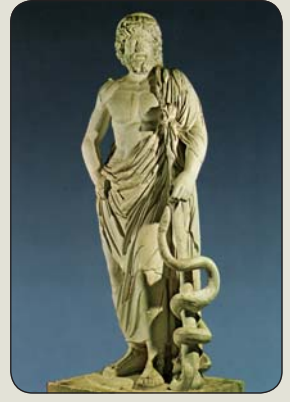
Božský lekár Asklépios z Epidauru

Tangaroa/Ta' roa, ako samosplodenec a stvoriteľ všetkého, vytvoril aj základ sveta Tumu-nui a jeho ženu zem Papu-raharahe, s ktorou mal syna - pána nebies Te-Fatua. Najväčším bohom - prvotným božstvom sa stal Tuu-metua/Tu otec/Tane (havajská trojica - boh svetla