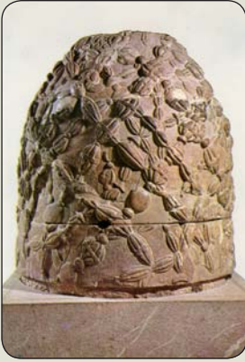
Delphský omfalos, ktorý pôvodne patrila Matke Zeme - Gai