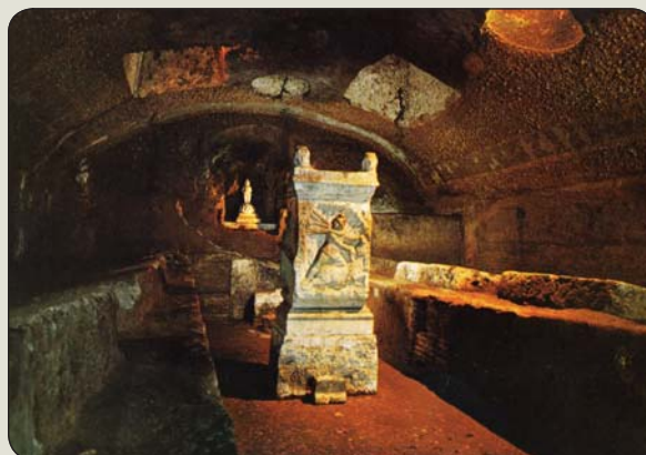
Podzemné mithreum pod Bazilikou di S. Clemente Savi v Ríme