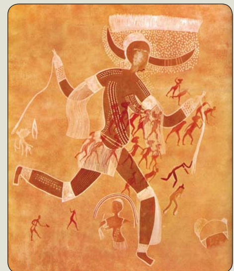
Tassili N' Ajjer