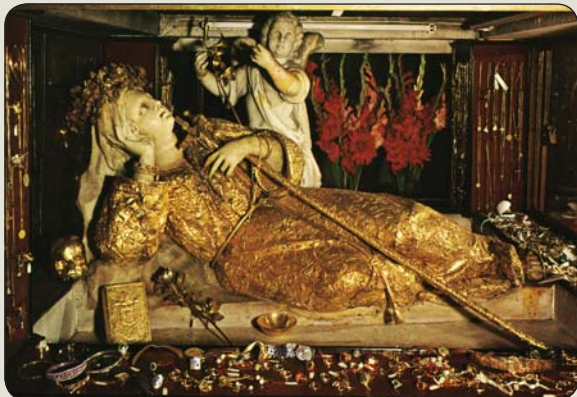
Monte Pellegrino - Santa Rosalia

Jaskyne pripomínajú minulosť, ale môžu znamenať aj budúcnosť. (JK)