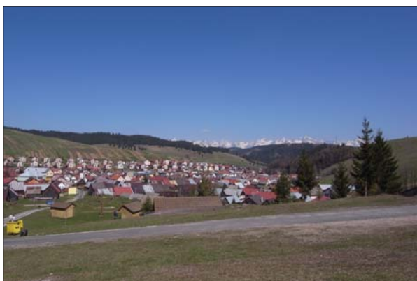
Obr. 3: Vysoké Tatry tvoria panorámu Liptovskej Tepličky s typickými úzkymi poličkami oranými na svahu proti smeru vrstevnic