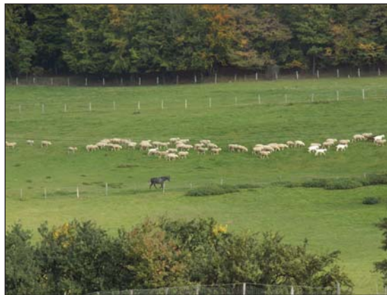
Obr. 5: Rozptýlené lazničné osídlenie Zaježovej vytvára priaznivé predpoklady udržateľného poľnohospodárstva. Chov oviec v tejto oblasti prispieva k produkcii syrov

podiel z celkovej rozlohy (95,8 %) mali farmy s priemernou výmerou využitej poľnohospodárskej pôdy v kategórii nad 50 ha a priemerná výmera v tejto kategórii podnikov bola 1 372 ha. Na Slovensku však hospodári veľké množstvo fariem s relatívne malou celkovou výmerou, ktorých ekonomický potenciál je relatívne nízky. V mnohých oblastiach významne prispievajú k udržiavaniu mimoprodukčných funkcií poľnohospodárstva (obr. 5).