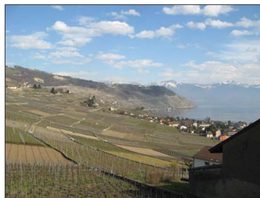
Obr. 4: Alpy v pozadí terasovitých viníc v Lavaux, ktoré boli v roku 2007 zapísané do Zoznamu svetového kultúrneho a prírodného dedičstva