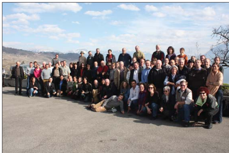
Obr. 1: Mnohonárodnostné zastúpenie na workshope OECD o využívaní agroenvironmentálnych indikátorov v politickom rozhodovaní potvrdilo potrebu ďalšieho vývoja a inovácie indikátorového hodnotenia v poľnohospodárstve (Leysin, Švajčiarsko, marec 2010)

Udržateľné poľnohospodárstvo rešpektuje požiadavky a životné podmienky zvierat, je humánne voči zamestnancom