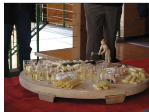
Obr. 6: Dozrievanie syrov v regionálnych syrárňach prevádzkovaných združeniami farmárov nie je v alpskom regióne ojedinelé. Syry nalezato aj nastojato. Každá fáza zrenia si vyžaduje inú polohu. A čo je hlavné, ale aj pracné, vždy ich treba čistiť a obracať. Švajčiarom pritom pomáha mechanizácia. Výroba syru L'etivaz, pochádzajúceho z Vaudských Álp, trvá tri roky. Alpské lúky, technológiu výroby, ako aj vzorky na ochutnanie a predaj domáci radi predstavia návštevníkom regiónu

tácii environmentálnej politiky do sektoru poľnohospodárstva a informujú o environmentálnej orientácii štátu. Environmentálny pilier sa stal jednou z priorit reformy Spoločnej poľnohospodárskej politiky na úrovni EÚ, ako aj vo Švajčiarsku. Reforma poľnohospodárskej politiky podporila aj rozvoj ekologického poľnohospodárstva. V roku 2008 sa na Slovensku realizovalo ekologické poľno-