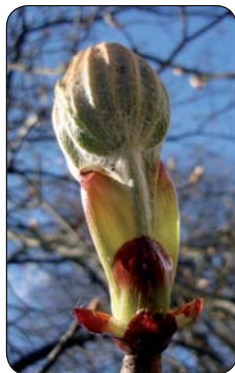
Pagaštan konský - pučanie

www.beagleproject.org môžu školy zapojiť do vedeckého výskumu sledovania fenologických fáz. Do projektu sa dosiaľ zapojilo 63 pilotných škôl z celého Slovenska. Pre učiteľov prihlásených škôl zorganizovala Slovenská agentúra životného prostredia v marci 2010 odborný tréning, na ktorého základe budú vedieť so žiakmi realizovať monitoring fenofáz, zbierať výsledky o konkrétnych štádiách vývinu stromov a sledovať bohatú biodiverzitu drevín. Získané výsledky budú vypovedať o tom, či dochádza k zmenám v priebehu životného cyklu stromu. Podrobnejším bádáním budú môcť mladí výskumníci odhaliť príčiny týchto zmien. Porovnaním údajov s historickými záznamami zistia ako sa mení priebeh jednotlivých ročných období. Vystavením výsledkov na webovú stránku bude možné konfrontovať slovenské dáta s ostatnými partnerskými krajinami projektu (Veľká Británia, Poľsko, Nórsko, Maďarsko, Nemecko), v ktorých bude prebiehať výskum podľa spo-