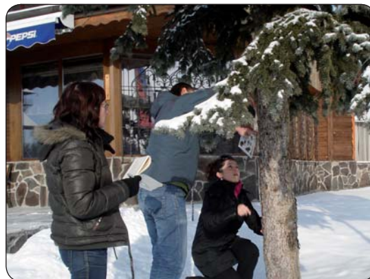
Meranie obvodu stromu

a plné sfarbenie) vybraných šiestich druhov stromov, ktoré sa bežne vyskytujú v blízkom okolí škôl. Od marca 2010 sa prostredníctvom online registrácie na stránke