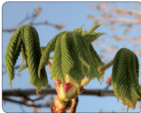
... a prvé listy

ločne stanovenej metodiky. Hlavným cieľom projektu je podporiť vzdelávanie priamo v prírodnom prostredí, teda „mimo školských lavíc“ a zefektívniť vedeckú prácu škôl. Do projektu sú zapojené aj odborné inštitúcie a to Slovenský hydrometeorologický ústav, Národné lesnícke centrum a dve univerzity; Univerzita Mateja Bela v Banskej Bystrici a