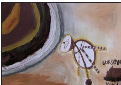
Kolektív žiakov, Súkromná ZUŠ, Ul. Aurela Stodolu, Martin, názov práce: Vesmírna sonda (cyklus), pedagóg: Mgr. Alexandra Pilková

najmä na základných školách pre umelecké predmety stále zhoršujú. Klesol aj počet ZŠ a MŠ a na mnohých ZŠ vyučujú výtvarnú výchovu učitelia, ktorí nemajú pre tento predmet kvalifikáciu.