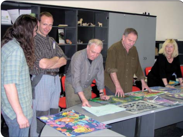
Porotcovia mali plné ruky práce

Tento ročník medzinárodnej súťaže detskej výtvarnej tvorivosti Zelený svet sa vyznačoval pomerne náročnou témou. Keďže rok 2009 je Medzinárodný rok astronómie, zamerali sme sa na tému, ktorá v sebe zahŕňa aj problematiku svetelného znečistenia. Je to téma široká, netýka sa len našej Zeme, ale aj vesmíru vôbec a súčasťou vesmíru sme my všetci.