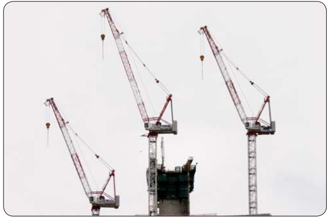
Každá doba po sebe niečo zanechá. Pamiatky, spomienky, rôzne trojice, tie sväté aj tie ostatné. Je na nás, čo chceme, aby zostalo. Či chceme, aby niečo zostalo.

aj nevedomé, na neho zvyknutého, znečistenia v duši. Čisto v duši začína uvedomením si niečoho. Nevie, ako „to“ niečo nazvať. Ale každý to zbadá pri inej príležitosti, jeden hoci pri videní niečoho podobného ako na fotografii zamrzutej kvapky na ihlici, iný zase keď mu cudzie dieťa podá kvety, alebo čo ja viem, na vrchole kopca s krížom... A ešte aj na druhej strane, ako opak k znečisteniu, krajina, kam ešte nezasiahli ľudské myšlienky. A na tretej strane, krajina, kde zasiahli ľudské myšlienky, ale nie tie „zadymené“. Práca ľudská, neodľudštená. A zároveň aj taký svet.“