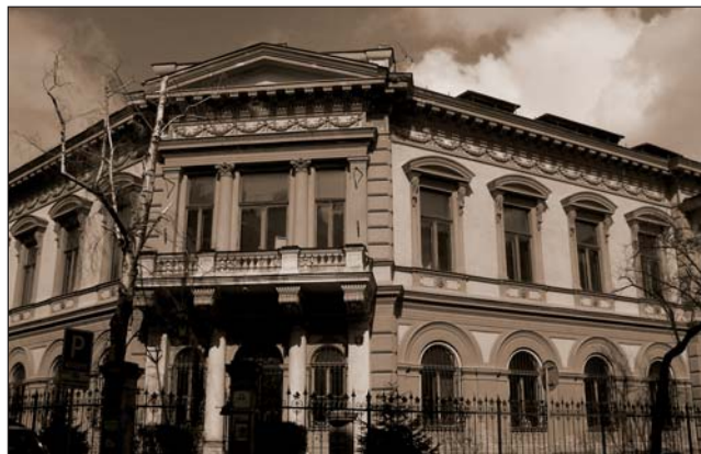
Prvé sídlo Vládneho komisariátu na ochranu pamiatok bolo v Bratislave na Konventnej ulici č. 1