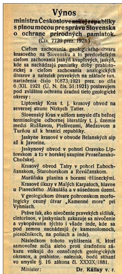
Výnos o ochrane prírodných pamiatok z roku 1923