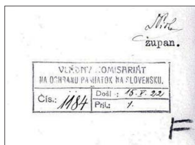
Pečiatka došlej pošty Vládneho komisariátu na ochranu pamiatok

K najdôležitejším úlohám, ktoré Štátny referát na ochranu pamiatok riešil, určite patrí príprava prírodného Tatranského parku, diskusia a legislatívna