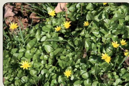
Solárny blyskáč jarný - atribút pankeltského boha Lughu

spomenutý vračič obyčajný / Tanacetum vulgare (neskôr na Veľkú noc pridávaný do potravín) a za účelom zvýšenia odvahy aj waleskú „rastlinu radosti“ borák lekárskejší / Borago officinalis , ktorý užívali aj križiaci. K rastlinám radosti (euphosyne) patrí aj očianka Rostkova / Euphrasia rostkoviana , aplikovaná ako čajovina a fajčivo. Z atribútu Artemis/Diany/Isis a sv. Jána - paliny pravej/ Artemisia absinthium sa za účelom odstránenia strachu pripravoval a pil v podstate škodlivý absint. Univerzálne ako fumigátor, čajovina, víno, liek, prísada do kadidla i kúpeľa pôsobil očisťujúci odpudzovač zla - repik lekárskejší / Agrimonia eupatoria . Na Imbolc nechýbala v kadidle Brigantiina hviezdica prostredná / Stellaria media , z ktorej pripravovali odvar, jarnú polievku a krmnú zmes. Biely kvet Márie Magdalény (pôvodne Dia/Jupitera, Artemis/Diany, Thora), symbol umučenia Krista a mučeníkov, margaréta biela / Leucanthemum vulgare (králik, lat. margarita = perla) sa prevažne počas ženských rituálov postupne uplatnila v čajoch, kadidlách a kúpeľoch v mnohých krajinách (stala sa kvetom Dánska) skoro s takou obľubou ako ruža/Rosa alebo spomenutá italia biela / Lilium