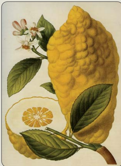
Citrónovník citrónatý - stará kultová a liečivá rastlina (z Nouveau Duhamel, 1768)

Novéj Virginie (jej zakladateľom Walterom Raleighom) tabak virginjský / Nicotiana tabacum , resp. tabak sedliacky / N. rustica (machorka), pomenovaný podľa francúzskeho vyslanca v Portugalsku a fajčiara Jeana Nicota de Villemain (tabak/piciyetl z indiánskych kalumetov/chalumeau/fajok mieru, vyrobených z nerastného tatinitu, hliny alebo dreva, pri otupovaní agresivitu vytlačil z európskych fajok, používaných od neolitu, iné fajčivá). V roku 1559 začali tabak pestovať v španielskych kráľovských záhradách a v roku 1561 aj vo Vatikáne ako bylinu Svätého Kríža, dokonca Božskú bylinu (tiež údajný liek proti americkej chorobe - syfilisu), ktorú nakoniec pápež Urban III. v roku 1621 zakázal pod trestom exkomunikácie. Vo Veľkej Británii však naďalej fajčili „britský tabak“ zo sušených listov podbela liečivého / Tussilago farfara a pili podbellové víno ; do kadidla i kúpeľa pridávali nezábudku lesnú / Myosotis sylvatica (mysie uško ako rastlina záhrobia a smrti) a zádušník brečtanovitý / Glechoma hederacea , z ktorého najmä na Ostaru pripravovali čajový odvar alebo pivo (náhrada chmelu). Údajne pre vízie najmä juhoázijské kmene až po Papuu-Novú Guineu pridávali do kadidla a nápoja zázvorovitú marabu - kemferiu galanganovú / Koemferia galanga ; Kelti na Ostaru a ďalšie národy v Európe pre znovuzrodenie/návrat slnečného boha