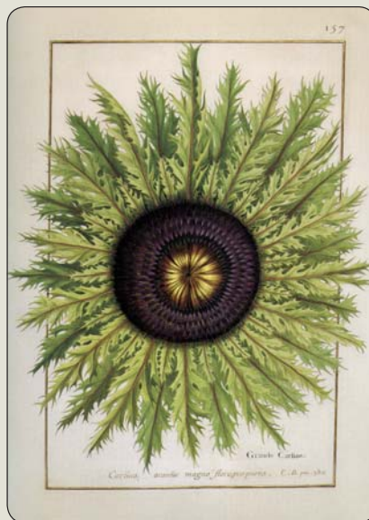
Krasovlas bezhľavý – rastlina snečných bohov (z Florilége du prince Eugène de Savoie, 1670)

Višnu. Verili, že ju páliovým jedom naplnil Had podsvetia a uštipol Veľký had/blesk. Žihľava pod posteľou chorého odháňala choroby a zavesená pred dverami plašila zlých duchov. Rimania ju používali na povzbudenie krvného obehu a proti reume; vo Veľkej Británii z nej ešte v 17. storočí pripravovali placky, polievky a puding. Žihľavový odvar a žihľavové pivo pili počas rituálov iniciácie a znovuzrodenia. Zo žihľavových vláken tkali rybárske siete, plachtovinu a plátno, zhotovovali uniformy a laná. Za týmto účelom však častejšie a vyše 5 000 rokov využívali pradené života – lan siaty/Linum usitatissimum , prípadne lan prečistujúci/L. catharticum . Jeho semenka dávali do mešcov/peňaženiek pre šťastie a bohatstvo; steblá rituálne spaľovali proti uhrnutiam, zlým silám a čarám už v Egypte a Mezopotámii, kde paril k atribútom Utua a Inanny (tiež Neit, Brigit, Huldy, Arachné...). Na konci Herfestu a Samhainu pridávali do kadidla aj semená zeleru voňavého/Apium graveolens . Na počtu Dia korunovali víťazov nemejských hier jeho vňatou. Zeler sa považoval za afrodisiakum, Diovu a hrobovú bylinu. Do pahreby a kadidelnice hádzali aj semená rascie lúčnej/Carum carvi , ktorá sa počas sviatkov Ostara a Herfest pridávala