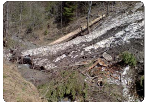
Pozostatky tohoročnej lavíny

cestu, ktorú skoro celú odtrhol a ostal z nej len úzky pásik na prechod. O pár metrov je merná stanica SHMÚ, za ktorou je malá studnička s možnosťou doplniť si zásoby vody.