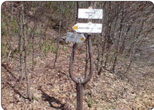
Turistický smerovník pri Pánskej kolibe