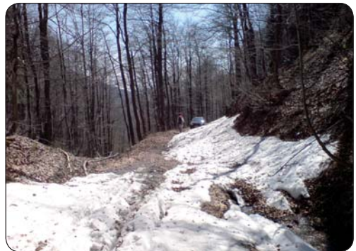
Cesta úplne pokrytá snehom