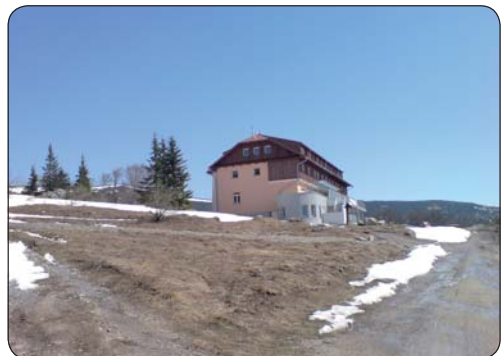
Hotel Kráľova studňa