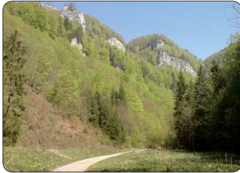
Scenéria skalných brál

Počasie je krásne, modrá obloha bez mráčikov, slniečko zohrieva svojimi jarnými lúčmi zem. Vychádzam z Banskej Bystrice z nadmorskej výšky 362 m cez Kostiviarsku a vedľajšou cestou cez Jakub, kde sa na konci dediny napájam na cestu 1. triedy č. 59 vedúcu na Donovaly. Keď prechádzam Novým Svetom, opäť musím konštatovať, že niektorých vodičov by bolo potrebné posadiť na bajk a prejsť okolo nich tak blízko na aute, ako to oni robia cyklistom, aby vedeli, aký je to pocit. Ale odpúšťavam sa od týchto myšlienok a snažím sa načerpať energiu z rozvíjajúcej sa jarnej prírody. Po jednom kilometri schádzam z hlavnej cesty a odbočujem do Uľanky. Na jej konci zisťujem, že som vo výške