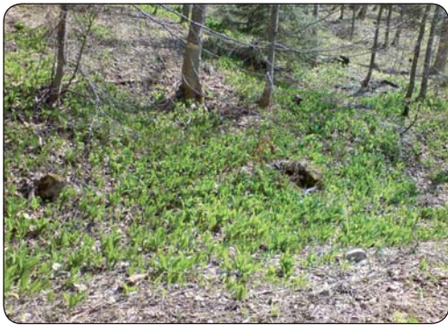
Lány medvedieho cesnaku