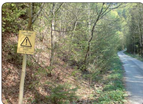
Výstražná tabuľka Lavinový terén

Počasie je krásne, modrá obloha bez mráčikov, slniečko zohrieva svojimi jarnými lúčmi zem. Vychádzam z Banskej Bystrice z nadmorskej výšky 362 m cez Kostiviarsku a vedľajšou cestou cez Jakub, kde sa na konci dediny napájam na cestu 1. triedy č. 59 vedúcu na Donovaly. Keď prechádzam Novým Svetom, opäť musím konštatovať, že niektorých vodičov by bolo potrebné posadiť na bajk a prejsť okolo nich tak blízko na aute, ako to oni robia cyklistom, aby vedeli, aký je to pocit. Ale odpúšťavam sa od týchto myšlienok a snažím sa načerpať energiu z rozvíjajúcej sa jarnej prírody. Po jednom kilometri schádzam z hlavnej cesty a odbočujem do Uľanky. Na jej konci zisťujem, že som vo výške