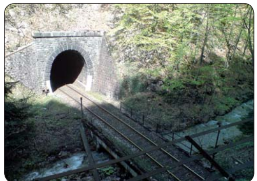
Tunel prerušený dolinou

Cesta na 14. km (600 m n. m.) začne prudšie stúpať nad tunel, ktorý tu vybehne z jednej strany úbočia doliny, pozrie sa či ide dobrým smerom a opäť sa vnorí do protilahlého úbočia, pričom železničná trať sa tu otočí a pokračuje opačným smerom ako ja. Ďalší výraznejší „stupáčik“ ma privítal na 16. km, kde pred pár rokmi spadnutá lavína zahatala nánosom kamenia a polámaných stromov cestu potoku vinúcemu sa údolím. Ten, aby mohol pokračovať vo svojej púti, sa zahryzol pod