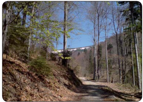
Cesta od Pánskej koliby na Kráľovu studňu

Hotel je po celkovej rekonštrukcii. Od personálu sa dozvedám, že by ho chceli v júli oficiálne otvoriť. Na chválu majiteľovi slúži, že aj počas rekonštrukcie bol otvorený pre turistov. Po občerstvení sa chutným bylinkovým čajom a zohriatím sa v presklennej časti terasy sa pobežím na spätnú cestu. Po informácii od cyklistov sa nepúšťam nadol cez Zalámanú dolinu, ako som pôvodne plánoval, ale opäť cez Bystrickú. Cesta nadol je, samozrejme, rýchlejšia. Scenéria rýchlo preblikáva okolo mňa, ale tú som si už vychutnal pri ceste nahor. Teraz mi už v hlave víria myšlienky o chutnom obede a oddychu po návrate. Do Banskej Bystrice prichádzam niečo po 14.30 hod., po 5 hodinovej túre a absolvovaní 44,96 km.