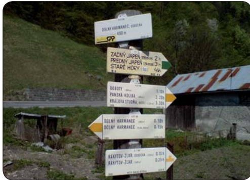
Turistický smerovník pri odbočke

Je druhá polovica apríla, nedeľné ráno niečo po pol desiatej. Sadám na bajk a vyrážam na trasu Banská Bystrica – Harmanec – Bystrická dolina – hotel Kráľova studňa a späť.