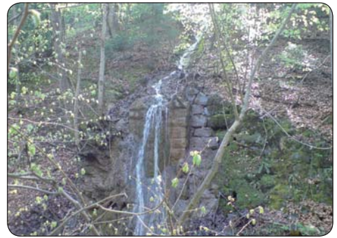
Malý vodopád prepadovej vody z tunela

Asfaltová cesta sa klúkať, potok jej nezostáva nič dlhý, vymieňa si s ňou pravú a ľavú stranu. Zo strmých úbočí stekajú menšie/väčšie potôčky, aby ukončili svoju púť v centrálnom potoku. Po bokoch lemujúce stromy ma vítajú svojou sviežou jasne zelenou farbou práve rozvíjajúcich sa lístkov, avšak smerom