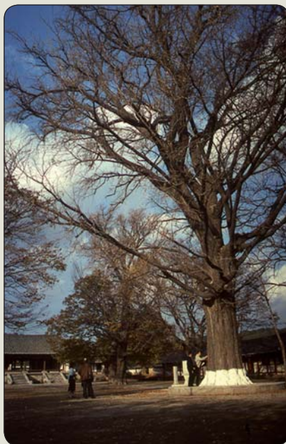
900-ročné ginkgo dvojločné v severokórejskom Kesongu

Samotná dubová ratolesť tvorí obrubu znakov Estónska a Baskicka, spolu s vavrínovou vetvičkou Francúzska a Mexika; brezová Chakaska, rododendróvová Karačajska-Čerkeska. Tri dubové listy tvoria obsah erbu Novej Dubnice, päť žaludov emblému Dubnice nad Váhom; konáriky brezy znaku Brezovej pod Bradlom a lipy Lipovian. Niekoľko krajín znázornilo vo svojich znakoch aj rôzne typické nestromové rastliny, napríklad Namíbia veličiu podivnú ( Welwitschia mirabilis ), Guayana amazonskú viktoriu kráľovskú ( Victoria regia ), Bangladéš štylizované leknó modrasté ( Nymphaea nouchali ). Nový Zéland si vybral pôsobivú stromovú papraď ponga – cyateu striebristú ( Cyathea dealbata ), V znakoch niektorých štátov a regiónov sa objavujú len kvety, napríklad Nigérie kostus nádherný ( Costus spectabilis ), Južnej Kórey kvet štylizovaného ibišteka sýrskeho ( Hibiscus syriacus ), Hongkongu bauhinie Blakeovej ( Bauhinia blakeana ako hybridu B. variegata + B. purpurea ), ostrova Mayotte kananky voňavej ( Cananga odorata ) zvanej