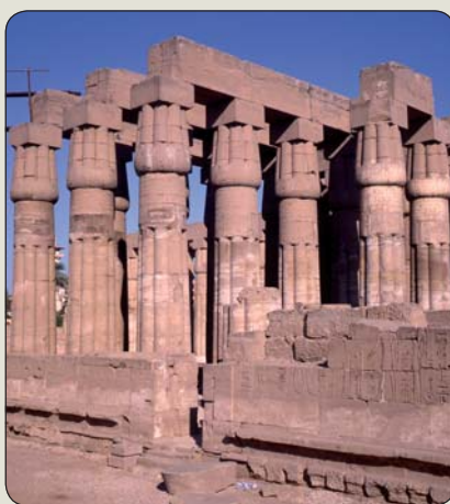
Papyrusový motív hlavíc stĺpov v Luxore

parakaučukovú ( Hevea brasiliensis ). Národnými drevinami sa stali: v Kolumbii najvyššia palma na svete (60 m) – voskovník quindijský ( Ceroxylon quindiuense ), v Chile araukária andská ( Araucaria araucana ), v Peru a Bolívii posvätný kvet inkov – kantuta krušpánolistá ( Cantua buxifolia ) spolu so strelčiovitou helikóniou zobákovitou – patujú ( Heliconia rostrata ), na Jamajke guajak posvätný ( Guaiacum sanctum ), na Antigue a Barbude kombretovitý „čierny olivovník“ – bucida rohatá ( Bucida buceras ) a agáva karatto ( Agave karatto ), v Chile zvonovitá lapagéria červená – copihue ( Lapageria rosea ), v Dominike „karibské drevo“ sapanovitá sabinea kýlovitá ( Sabinea carinalis ). Pre pôsobivú farebnosť kvetov sa v Uruguayi národnou rastlinou stal koralník hrebenitý – ceibo ( Erythraea crista-galli ) so žltokvetým – peltoforom pochýbnym ( Peltophorum dubium ); tiež v Argentine, kde ceibo dopĺňa jakaranda mimozolistá ( Jacaranda mimosifolia ). Republiku Sv. Krištof a Nevis a americké Mariánske ostrovy reprezentuje tzv. horiaci strom – flamboyant – červenokvetá cezalpinová poinciana kráľovská ( Delonix regia ), Trinidad a Tobago marenovitá varševicia šarlátová ( Warszewiczia coccinea ), Mexiko Montezumov tisovec pichľavý – ahuehuete ( Taxodium mucronatum ), Madagaskar mohutný baobab madagaskarský ( Adansonia