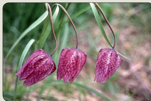
Korunkovka strakatá - kvet švédskeho Upplandu