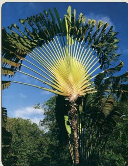
Ravenala madagaskarská – palma pútnikova

kašmírsky ( Cupressus cashmeriana ), v Myanmare o santalovec indický – paduak ( Pterocarpus indicus ), ktorý sa stal so sambakom – jazmínom sambakovým ( Jasminum sambac ) aj národnou drevinou Filipín (sambak osobitne v Indonézii). V Malajzii tento druh nahrádza ibišteľ čínsky ( Hibiscus rosa-chinensis ), v sultanáte Brunej diélnia polokrovitá – simpór ( Dillenia suffruticosa ), v Kambodži z ánonovitých rumdul ( Mitrella mesnyi ), resp. na hranici s thajskou provinciou Sisaket melodorum krovitý – diablov strom ( Melodorum fruticosum ). V Indii a Bangladéši sa podľa budhistických a hinduistických tradícií stal národným stromom banyán – figovník bengálsky ( Ficus bengalensis ), ktorého hlavný kmeň dosahuje obvod až 10 m a výšku 50 m. Tento dopĺňa chlebovník rôznolistý – jackfruit ( Artocarpus heterophyllus ). V Guatemale už oddávna Mayovia považovali za posvätný strom vlnovec päťčinkový ( Ceiba pentandra ) a za národný kvet líkstu čistú ( Lycaste virginalis ). V Belize ide o spomenutý mahagónovník veľkolistý ( Swietenia macrophylla ) spolu s čiernou orchideou ( Encyclia cochleata ), v Dominikánskej republike o mahagónovník pravý – caoba ( Swietenia mahagoni ), v Paname o lajnovcec bezlupienkový ( Sterculia apetala ), v Brazílii o brazílske drevo – cezalpinu ježatú ( Cesalpinia echinata ) spolu s palmou kráľovskou venezuelskou ( Roystonea oleracea/venezuelana ), i keď na viacerých miestach tu uctieujú a využívajú heveu