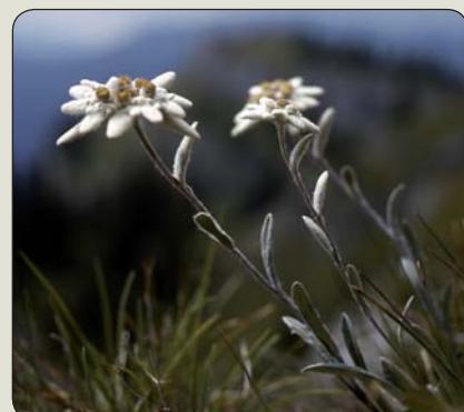
Plesnivec alpský – kvet Rakúska a Švajčiarska

Montane, borovica červená ( P. resinosa ) v Minnesote, borovica podhorská ( P. monticola ) v Idahu, borovica kadidlová ( P. taeda ) v Arkansase, borovica močiarna ( P. palustris ) v Alabame, borovica sladká ( P. edulis ) v Novom Mexiku, borovica stočená ( P. contorta ) v Alberte, smrek pichľavý ( Picea pungens ) v Utahu a Colorade, smrek čierny ( P. mariana ) v Newfoundlande, smrek biely ( P. glauca ) v Južnej Dakote a Manitobe, smrek sitkanský ( P. sitchensis ) v Aljaške, jedľa balzamová ( Abies balsamea ) v Novom Brunswicku, jedľa plstnatoplodá ( Abies lasiocarpa ) v Yukone, smrekovec americký ( Larix laricina ) v Severozápadnom teritóriu, tisovec dvojradový ( Taxodium distichum ) v Louisiane, ľaliovník tulipánokvetý ( Liriodendron tulipifera ) v Indiane, Kentucky a Tennessee, dub virginický ( Quercus virginiana ) v Georgii, dub šarlátový ( Q. coccinea ) vo Federálnom distrikte Kolumbia, dub veľkoplodý ( Q. macrocarpa ) v Iowe, dub biely ( Q. alba ) v Marylande, Illinois a Connecticute, dub červený ( Q. rubra ) v New Jersey a na Ostrove princa Edwarda, topol' deltolistý ( Populus deltoides ) v Nebraske, Kansase a Wyomingu, brest americký ( Ulmus americana ) v Massachusetts a Severnej Dakote, cezmina tmavá ( Ilex opaca ) v Delaware, parkinzónia floridská ( Parkinsonia florida ) v Arizone, hikoríia pekanová ( Carya illinoensis ) v Texase, javor červený ( Acer rubrum ) v Rhode Island, javor cukrodarný ( Acer saccharophorum ) v Západnej