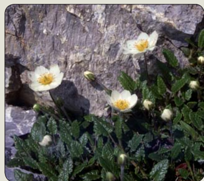
Dryádka osemľupienková – kvet Islandu

madagascariensis), Juhoafrickú republiku nohovec širokolistý ( Podocarpus latifolius ), Tanzániu dalbergia čiernodrevá – mpingo ( Dalbergia melanoxylon ) využívaná v drevorezbárstve, Austráliu akácia hustokvetá ( Acacia pycnantha ), ktorú v poslednej dobe dopĺňa jeden z najstarších stromov na svete („živá skamenelina“ staršia ako 200 mil. rokov) – až 40 m vysoká druhohorná volemia vznešená ( Wollemia nobilis ), objavená iba 10. septembra 1994 Davidom Noblem v Novom Južnom Walese asi 150 km severozápadne od Sydney v Blue Mountains (dnes v NP Wollemi). Na Novom Zélande sa takto prístupuje k 50 m vysokej araukárii kauri – damarovníku južnému ( Agathis australis ), ktorý rástol pôvodne na 1,2 mil. ha (dnes 140 ha). Novozélandským štátnym kvetom sa stali sofora drobnolistá – kowhai ( Sophora microphylla ), resp. sofora štvorkrídla ( S. tetraptera ). Každý štát USA a každá provincia Kanady majú svoj „štátny strom“ i „štátny kvet“. Medzi „štátnymi stromami“ nechýba sekvojovec mamutí ( Sequoiadendron giganteum ) v Kalifornii, duglaska tisolistá ( Tsuga menziesii ) v Oregone, jedľovec rôznolistý ( Pseudotsuga heterophylla ) vo Washingtone, jedľovec kanadský ( Tsuga canadensis ) v Pensylvánii, tuja riasnatá ( Thuja plicata ) v Britskej Kolumbii, borovica hladká – vejmutovka ( Pinus strobus ) v Maine, Michigane a Ontariu, borovica oriešková ( P. monophylla ) v Nevade, borovica ťažká ( P. ponderosa ) v