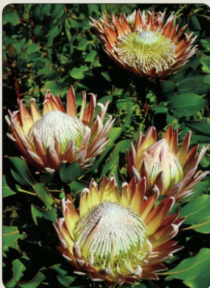
Protea artičoková - štátny kvet Juhoafrickej republiky

(Severozápadné teritórium), ktorú vyhlásili aj za národný kvet Islandu. Obdobne margarétu bielu/ Leucanthemum vulgare okrem Severnej Karolíny tiež v Lotyšsku. K exotickjším „štátnym rastlinám“ patria kaktusovec obrovský - saguaro ( Carnegiea gigantea ) v Arizone, kvitnúca juka sivá ( Yucca glauca ) v Novom Mexiku, ibištek havajský ( Hibiscus brackenridgei ) na Havaji, indiánsky „prériový oheň“ - červená kastileja ľanolistá ( Castilleja linariifolia ) vo Wyomingu, mäsožravá saracénia purpurová ( Sarracenia purpurea ) na Newfoundland. Kým zlatobyľ kanadskú ( Solidago canadensis ) si vybrali za štátny kvet Kentucky a zlatobyľ obrovskú ( Solidago gigantea ) Nebrasky, na Slovensku ide o nežiaduce invázne rastliny. Slnčnica ročná ( Helianthus annuus ) sa stala kvetom Kansasu, ale aj časti Číny, Ruska a Ukrajiny, kde za národnú rastlinu považujú aj kalínu/ Viburnum ; v Rusku rumanček kamilkový ( Matricaria recutita ) a v Číne všehoj ázijský - žeňšen ( Panax ginseng ), chryzantémovku/ Chrysanthemum , pi-