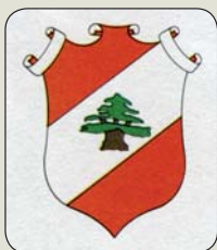
Znak Libanonu - céder

Niektoré druhy rastlín, najmä stromov, stali sa vo viacerých krajinách symbolom ich osobitosti, života a národnej hrdosti, nezriedka znázornených aj v ich štátnych znakoch a na zástavách. Takto zobrazil napríklad Libanon mohutný pyramidálny céder libanónsky ( Cedrus libani ), ktorý fažili za účelom zhotovovania lodí, nábytku, brán palácov a honosných truhliel už staroveké Egypťania, o čom sa dozvedáme z najstaršej písomnej zmienky o dovoze „dreva aš“ na 40 lodiach z foinického Byblosu počas vládnutia faraóna Snofrua (2613 –