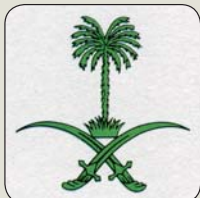
Znak Saudskej Arábie - datľovník

svietnika (menorah), zapáľovaného počas sviatku chanuka (od roku 165 prnl.), ale aj Cypru, kde ju v zobáku drží letiaca holubica. V Grécku sa tradične uplatňuje Apolónov vavrín bobkový ( Laurus nobilis ), ktorý zahrnuli spolu s olivovou ratolesťou do znaku Uruguaya a s dubovou ratolesťou do znaku Talianska a San Marína.