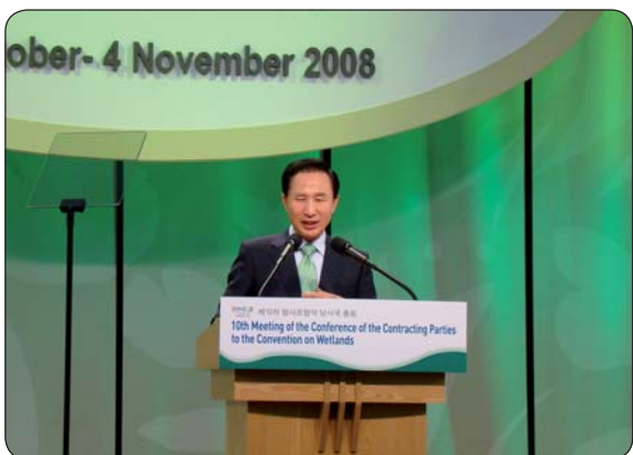
Prezident Kórejskej republiky Lee Myung-bak otvoril zasadnutie

Juhokórejské mesto Changwon v juhovýchodnej časti provincie Gyeongsang hostilo v dňoch 28. októbra až 4. novembra 2008 dosiaľ najväčšie zasadnutie Konferencie zmluvných strán Dohovoru o mokradiach (Ramsar, Irán, 1971). Zmluvné strany Ramsarského dohovoru sa stretávajú každé tri roky, aby zhodnotili plnenie svojich záväzkov pri zabezpečovaní ochrany a trvalo udržateľného využívania mokradí na svojom území, plnenie strategického plánu dohovoru za určité obdobie a stanovili si priority pre ďalšie roky. Desiate zasadnutie konferencie (COP10) prenieslo rokovania prvýkrát na pevninský ázijský kontinent (v roku 1993 bolo 5. zasadnutie v Kushire v Japonsku) a bol to úspešný krok pre účastníkov konferencie i pre domácich obyvateľov a organizátorov. Týmto podujatím žilo doslova celé mesto a na každom kroku sme sa mohli stretnúť s pútačmi na COP10 výzdobou, transparentmi, kultúrnymi podujatiami, výstavami a so všadeprítomnými dobrovoľníkmi (bolo ich vyše 300), ktorí pomáhali orientovať sa v obrovskom komplexe nového výstavného a konferenčného centra moderného mesta Changwon, ale aj v spleti podujatí a hotelov.