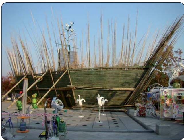
Bambusová Zelená archa - ukážka ako riešiť problémy spojené s klimatickou zmenou