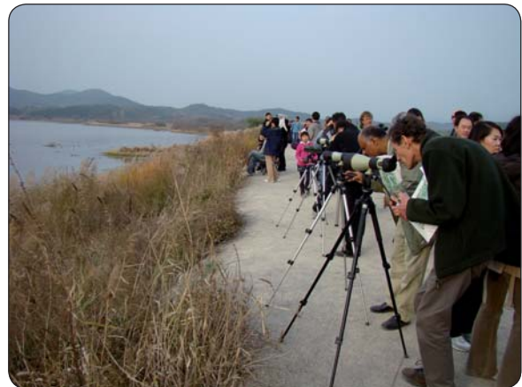
Účastníci konferencie využili možnosť pozorovať bohaté zastúpenie vtáctva v mokradi

RNDr. Ján Kadlečík ŠOP SR Banská Bystrica