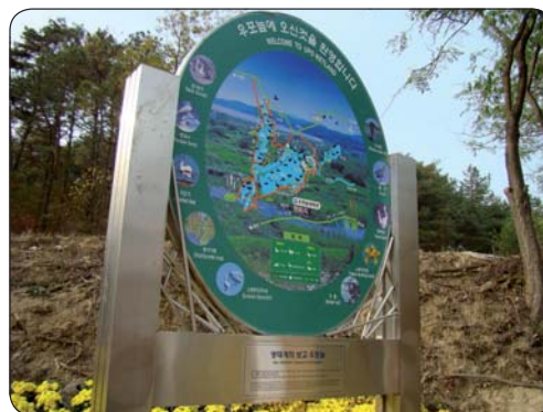
Netradične riešená mapa ramsarskej lokality

Pred konferenciou zmluvných strán bol v Changwone otvorený ramsarský Eko-park na počesť zasadnutia Ramsarského dohovoru. Mesto Changwon a provincia Gyeongsang investovali 800 miliónov wonov do parku pozostávajúceho z jazierka v tvare provincie a 123 metrového dreveného mosta nad jazierkom. Vysadené sem boli vodné rastliny z chráneného územia