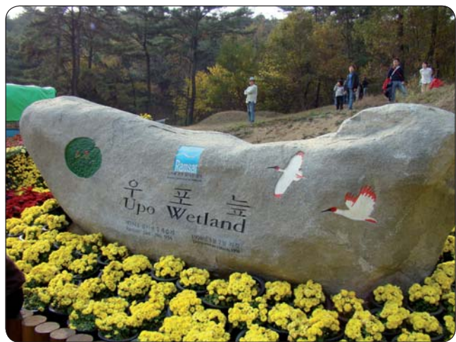
Originálne označenie názvu ramsarskej lokality Upo