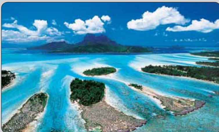
Bora Bora French Polynesia