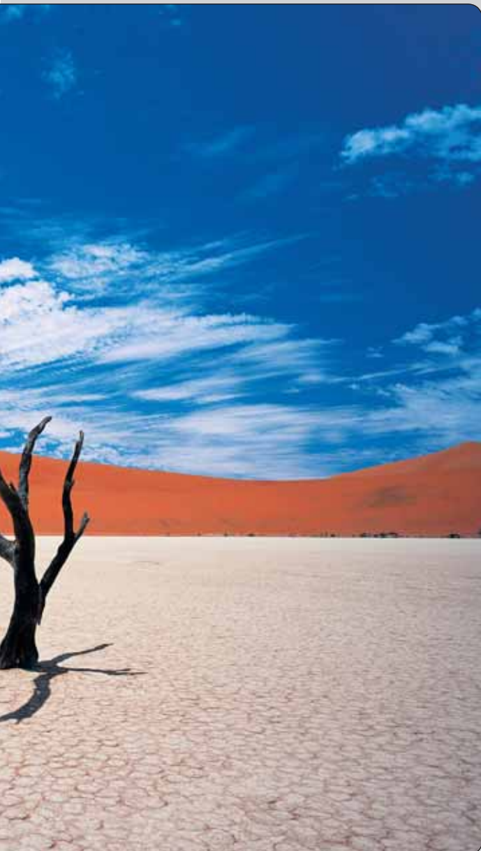
Dead Vlei, fotografia ideového plagátu Envirofilmu 2008