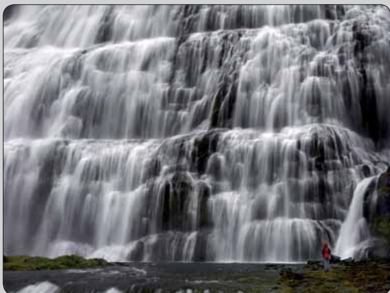
Dynjandi Falls Iceland