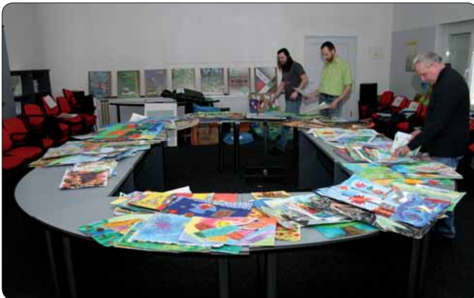
Hravosť farieb, tvarov a nápadov o živote pre budúcnosť zachytená v 3 825 výtvarných prácach

Animovaný film je prestížna kategória Zeleného sveta, ktorá má z roka na rok viac priaznivcov. O filmové stvárnenie témy sa pokúsilo až 60 detí z 11 slovenských škôl v 34 filmoch. Vysoká účasť v tejto kategórii organizátorov i samotných porotcov najprv potešila, no neskôr smutne prekvapila. Do kategórie prišlo aj niekoľko filmov, ktoré neboli animované, naopak išlo o hrané klipy alebo pokusy o dokumentárny film. „Zo súťažných animovaných filmov nás asi 8 filmov veľmi