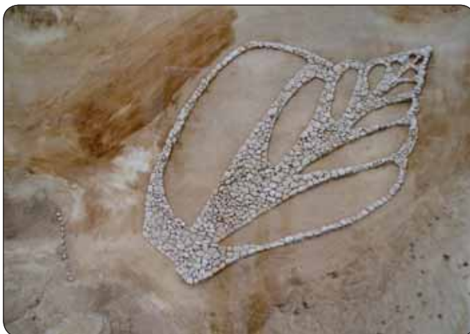
Plátok (Izrael, marec 2003)

A. Rogers vytvára po celom svete reťazce kamenných sôch - geoglyfy. S nápadom vytvoriť svetový krajinný sochársky cyklus autor prišiel v roku 1996. Sochy väčších rozmerov realizované z kameňa umiestnené v krajine, predstavujú miestne známe dávny symbol. Sú zamyslením sa