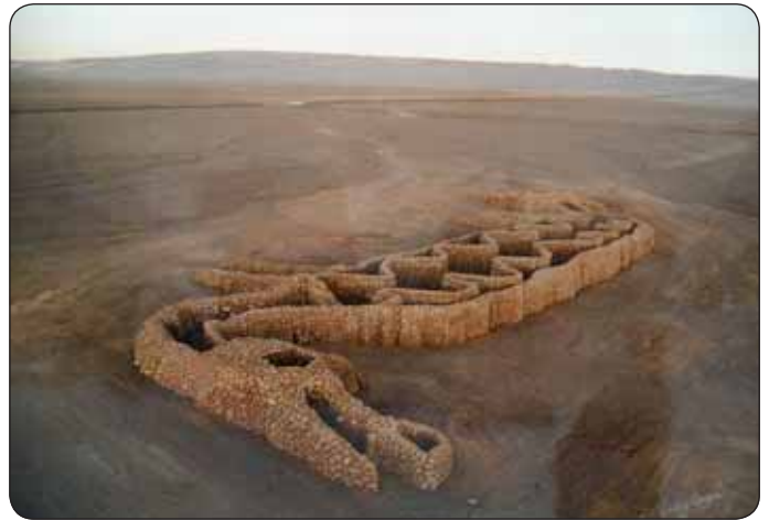
Starodávne jazyky (Čile, september 2004)

nad minulosťou a výzvou, odkazom pre budúcnosť. Projekt Rytmus života je jedným z najväčších súčasných umeleckých krajinných projektov na svete. Názov je odvodený od predošlých bronzových sôch. Sochy z cyklu Rytmus života , vo forme kamenných geoglyfov, popri geoglyfoch týkajúcich sa dedičstva tej-ktorej krajiny, budú umiestnené na 12 rozličných miestach sveta. Každá „stavba“ pozostáva z obrazcov na povrchu zeme, ktoré majú rozmery až do 200 x 100 m. Doteraz bolo zrealizovaných celkovo osem geoglyfických stavieb z 12-dielneho cyklu v týchto krajinách: Izrael (1999, 2004 púšť Arava), Čile (2004 púšť Atacama), Bolívia (2005 The Altiplano, Potosi), Srí Lanka (2005 Kurunegala), Austrália (marec 2006), Island (september 2006), Čína (október 2006) a India (február 2007). Predpokladá sa, že do tohto projektu bude zapojených viac ako 5 000 ľudí zo šiestich kontinentov. Diela majú aj environmentálny podtón. Napr. inštalácie v Číne pomáhala realizovať čínska armáda.