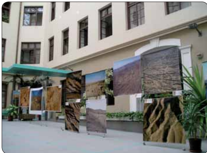
Výstava fotografií A. Rogersa v átriu MŽP SR (marec 2008), foto: P. Mišíková