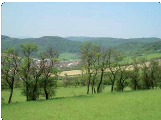
Obec Omšenie v Strážovských vrchoch

s umelcami - predovšetkým s výtvarníkmi, filmármi, fotografmi, historikmi umenia a s krajinármi a geografmi a ich „prerobovaním krajiny“. Kampaň je sústredená na lokálnu úroveň, aby zostala čo najtrvalejšia stopa v jednotlivých navštevovaných obciach. Predchádza tomu spracovanie prípravných krajinárskych štúdií o hodnotách predmetných území v kontexte s Karpatmi, regionálnymi a miestnymi špecifikami, spracovanie pilotných vizuálnych programov, audiovizuálnych pásiem, filmu zameraného na pozíciu Karpát. Výber zastávok bude vychádzať z existujúcej informačnej databázy o území, vrátane dokumentárnych filmov, novovytvorených dokumentov, existujúcich fotografií a pod., ale zároveň ochoty predstaviteľov obce a miestnych lídrov zúčastniť sa informačnej kampane. Kritériom je aj existencia regionálnej alebo miestnej expozície múzea alebo galérie, kde je možné ponechať