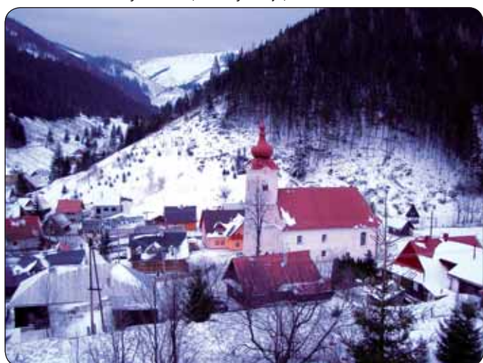
Vyšná Boca v Nízkyh Tatrách (E. Jauschová)

L'idée de la création du projet „L'hommage aux Carpates“ émane de la nécessité de raconter de nouveau et plus personnellement, systématiquement et aimablement les valeurs naturelles, culturelles et historiques du paysage slovaque. Le projet, en tant que campagne d'information, est orientée vers le renforcement de la relation des gens envers leur paysage, l'augmentation de la perception dans la protection de la diversité biologique, paysagère et culturelle des endroits individuels de la Slovaquie, la perception des valeurs du paysage, particulièrement de territoires naturels protégés et des éléments paysagers importants. La campagne est basée sur la nécessité de connaître et comprendre la diversité de types de paysage qui constituent notre richesse européenne commune. Une campagne intégrale orientée vers la promotion de valeurs du paysage n'a pas encore été élaborée ou mise en œuvre en Slovaquie. Selon la Convention Européenne du Paysage, l'objectif de la campagne est de définir la qualité cible de paysage qui prend en compte les désirs et les exigences du public posés au paysage dans lequel les gens voudraient vivre. Elle expliquera la position des Carpates et de la Slovaquie vis-à-vis des autres pays européens; elle sera pourtant concentrée sur le niveau local. Les zones audiovisuelles accompagnatrices feront partie mobile des installations d'un bus spécial qui s'arrêtera, selon un programme, dans les villages et festivals choisis en avance.