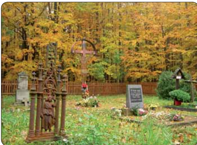
Hucokársky cintorín, Modra-Piesok

Ďalším aspektom v projekte kampane je motív „zastavenia sa v krajine“, ktorý je transformovaný do priamych zastávok vo vybraných územiach a obciach. Na základe dokumentárnych fotografií, filmov a maľieb, literárnych diel, ktoré umožnia emotívnu aj odbornú interpretáciu vybraných území pre verejnosť, je informačná kampaň založená na spolupráci