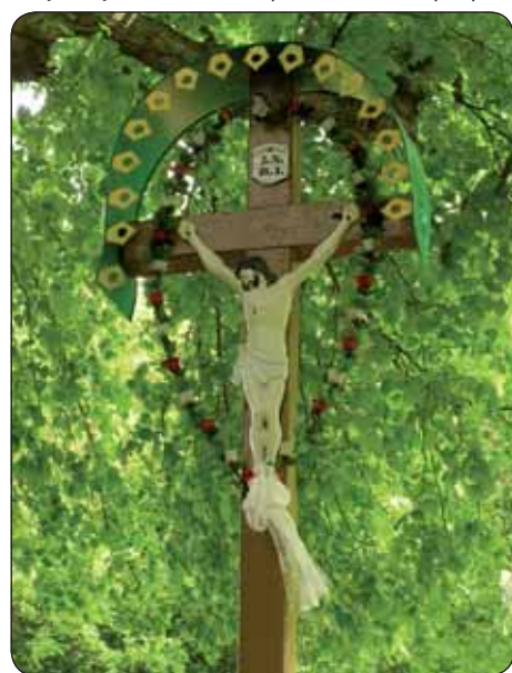
Na úpätí Žihlavníku medzi Omšením a Slatinkou nad Bebravou