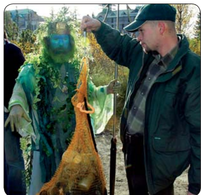
V úlohe Poseidona správa už niekoľko rokov aj tatranský festival potápačských filmov

Áno, a pionierski pracovníci sme aj boli. Vedúci pionierskych skupín, vychovávateľa. Keď som sa vrátil zo školy