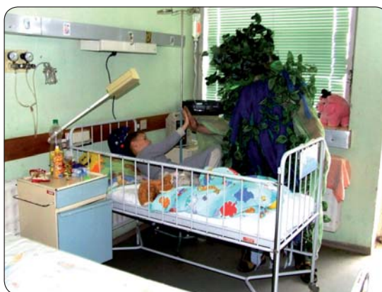
Už niekoľko rokov filmári a hostia Envirofilmu navštevujú choré deti v banskobystrickej Rooseveltovej nemocnici. Tatko Príroda nikdy medzi nimi nechýba...

No áno, a potom sa to všetko nejakom zomlelo, chlapi išli na vojnu, poženili sme sa... a zostal som sám. Popri zamestnaní som sa vrhol na pantomímu. Robil som predstavenia, do Popradu na súťaž malých javiskových foriem