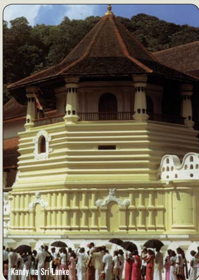
Kandy na Srí Lanke