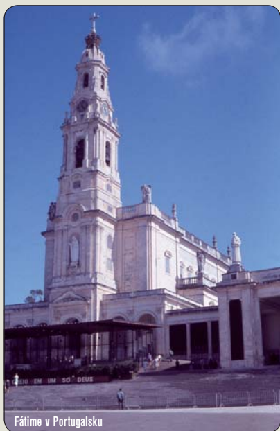
Fátima v Portugalsku