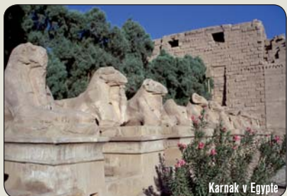
Karnak v Egypte