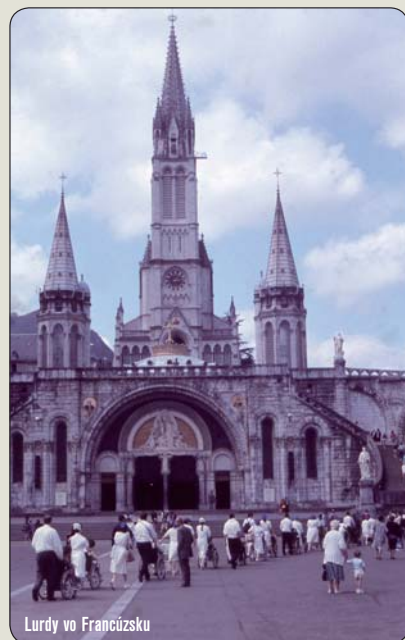
Lurdy vo Francúzsku