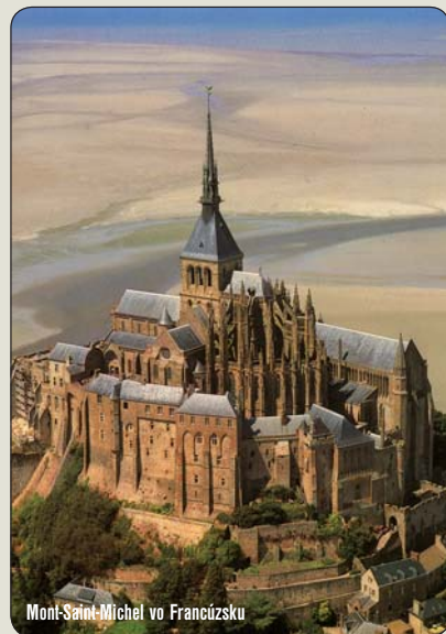
Mont-Saint-Michel vo Francúzsku