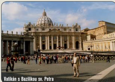
Vatikán s Bazilikou sv. Petra