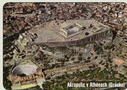
Akropolis v Athénach (Grécko)