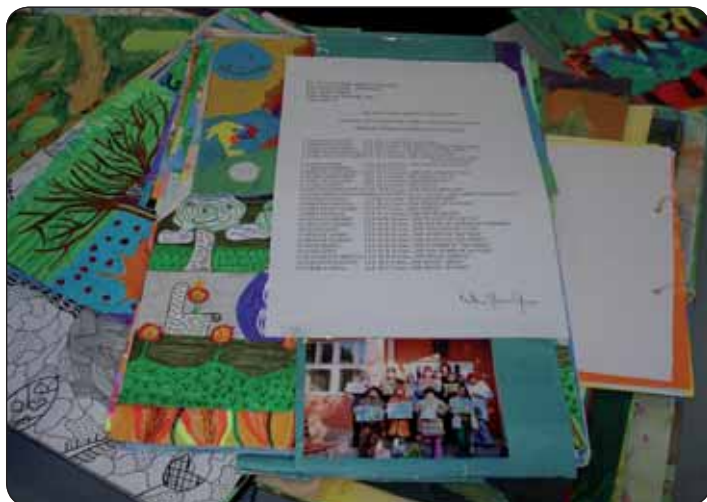
Kolekcia 72 rozprávkových prác o prírode prišla zo základnej školy v rumunskom Satu Mare

Porotcovia to pri hodnotení kvality umeleckého prevedenia hlavne myšlienky súťaže, pri množstve odlišných štýlov, techník, videnia a čítania detí naozaj nemali ľahké. Zhodli sa na tom, že väčšina prác odzrkadľovala myslenie detí príslušného veku. Boli však aj práce, ktorým chýbal súzvuk s danou tematikou a adekvátnym prejavom príslušného veku. Pôsobili chladne, technicky,