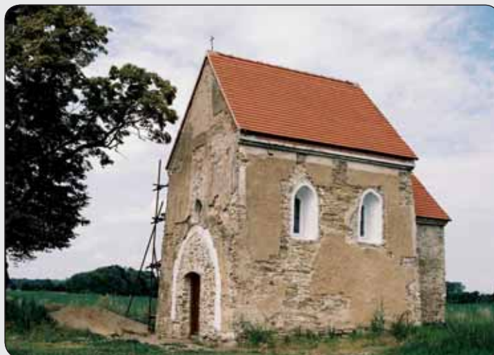
Kostol sv. Margity Antiochijskej v Kopčanoch

Stredoveké kostolíky s nástennými maľbami sú výnimočným príkladom typu architektonických súborov, ktoré ilustrujú významné obdobie v histórii. Hodnoty a jedinečnosť stredovekej maliarskej produkcie vo vidieckych kostoloch Gemera a Abova výrazne prekračujú hranice Slovenska. Ich ikonografická rozmanitosť