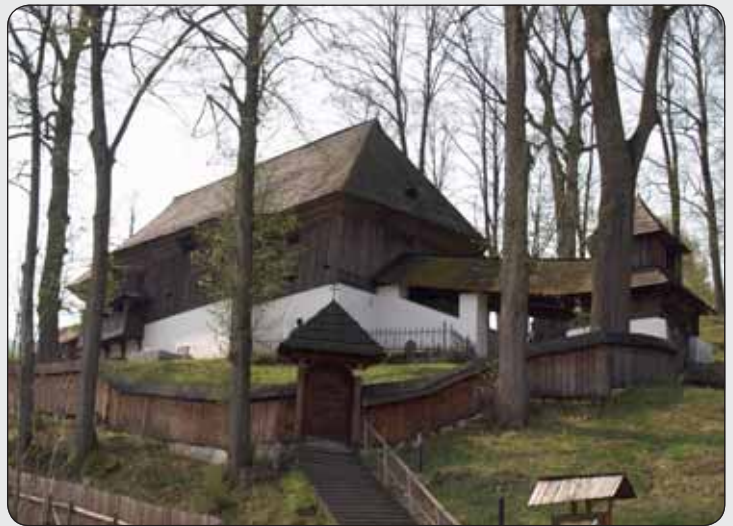
Evanjelický kostol v Leštínach

mikulčickej sídliskovej aglomerácie, ktorý poskytuje obraz o veľkomoravských sakrálnych stavbách. Okolo Kostola sv. Margity sa zachovali pozostatky sídla, ktoré sú dokladom sociálnej, ekonomickej a politickej štruktúry organizovanej komunity v 9. storočí a jej transformácie v nových hospodársko-politických podmienkach 10. - 13. storočia. Táto lokalita je i priamo spojená s rozširovaním kresťanstva a alfabetizácie národov ranostredovekej strednej Európy - Cyrilom a Metodom. Je navrhovaná na zápis do Zoznamu SD podľa kritérií (ii), (iii), (iv), (v), (vi).