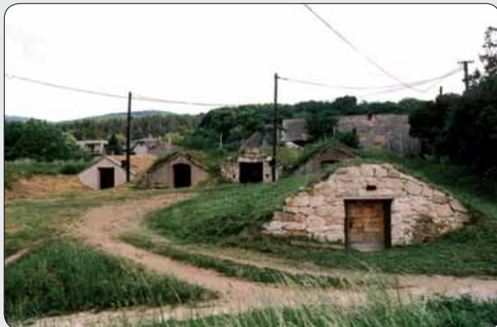
Tokajská vinohradnícka oblasť - vchody do pivníc

V termíne k 1. februáru 2007 Slovenská republika predložila do Centra svetového dedičstva v Paríži za kultúrne dedičstvo 2 nominácie - Pevnostný systém na sútoku riek Dunaja a Váhu v Komárne - Komárome