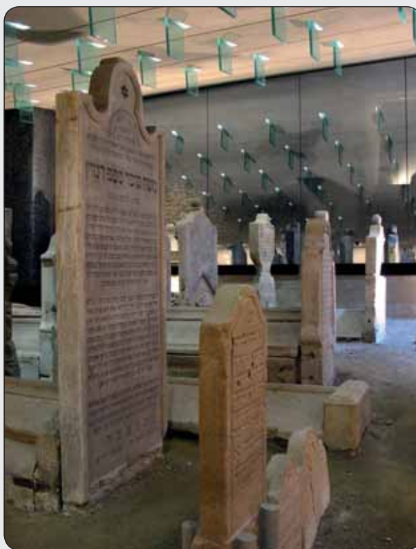
Pamätník Chatama Sófera

miest sa vyskytujú výlučne na východnom Slovensku, pričom Košice tvoria najväčšie a najzachovalejšie z nich. Nominácia je pripravovaná na zápis do Zoznamu SD podľa kritéria (ii), (iv) a (v).