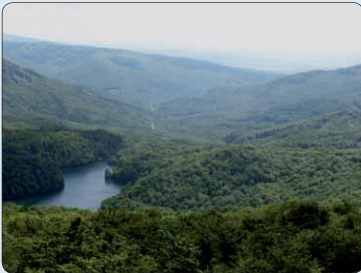
Vihorlat