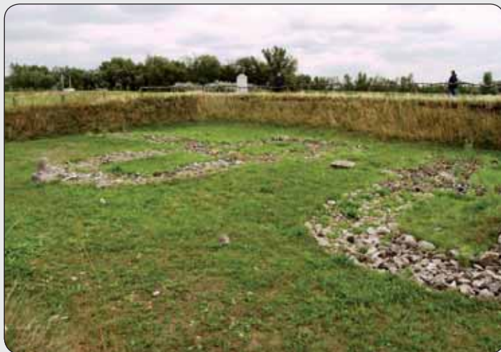
Limes Romanus (Iža)

lokality, kde, na rozdiel od iných podobných sídliskových aglomerácií z tohto obdobia, vývoj v neskoršom období nepokračoval. Kostol sv. Margity Antiochijskej v Kopčanoch je výnimočným príkladom cirkevnej architektúry ako jediná zachovaná murovaná veľkomoravská stavba. Je nositeľom výnimočnej kultúrnej tradície počiatku kresťanstva na tomto území. Z hľadiska historického kontextu ho možno označiť za XIII. kostol