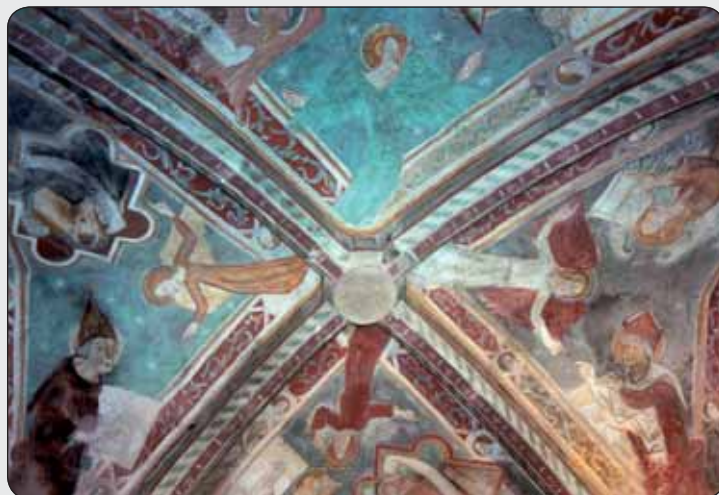
Stredoveká nástenná maľba v kostole v Chyžnov

Typ šošovkovitého konceptu zástavby centra mesta Košice predstavoval významný vplyv na vývin urbanizmu a je výnimočným príkladom typu zástavby, ktorá ilustruje významné obdobie v histórii urbanizácie. Je výnimočným príkladom tradičného osídlenia, ktoré sa stalo zraniteľné pôsobením nezvratných hospodársko-sociálnych zmien. Obdobné typy zástavby historických jadier