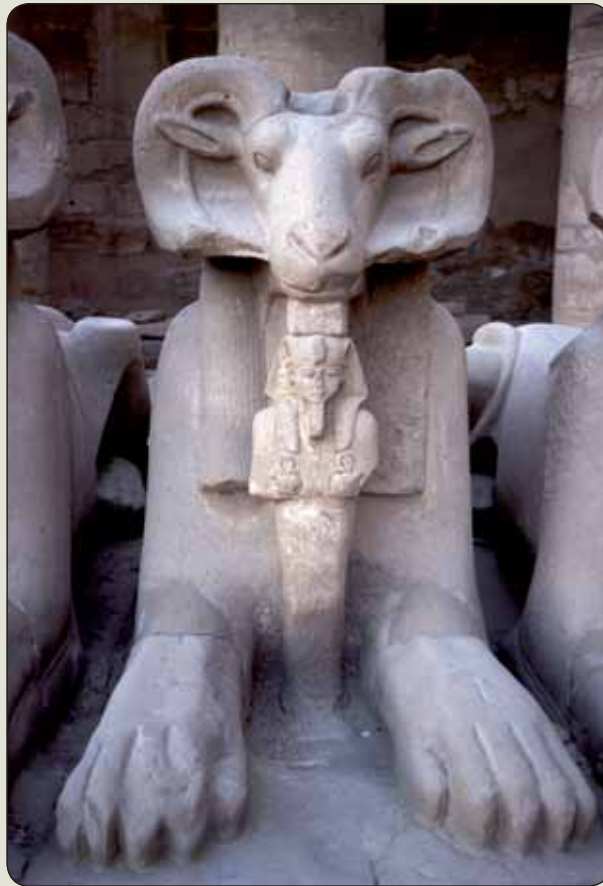
Baran ako symbol Amona v egyptskom Karnaku

na nebesiach Takama-no-hara zahŕňali Ame-no-mi-naka-nuši-no-kami ako vládcu stredú a temné prabytosti Taka-mi-musubi-no-kami a Kami-musubi-no-kami (podstatu nebies nazývali Kokuzó). Na ich podporu sa z praoceánu vynorili Umashii-ashi-kabi-hiko-ji-no-kami a Ame-no-toko-tachi-no-kami. Po nich Kun-ino-toko-tači a Tojo-kumo-no a päť nebeských bohov Ama-cu-kami (Uhidžini so Suhidžini, Cunogui s Ikugui, O´tonodži s O´tonbe, Omodaru s Ajakašikone, Izanagi-no-mikoto s Izanami-no-mikoto, bohyňou matkou) stvorilo Veľkú krajinu 8 ostrovov Ójašinaguni (dnes Japonsko). Izanami porodila veľa bohov, vrátane božstva (ducha = kami) ohňa Kagutsuchi/Kagu-cuči-no-kami/Ho-no-kaga-bi-ko/Ho-musubi-no-kami (tiež ako božstva obnovy prírody), pričom pri jeho pôrode z popálenín uhynula.