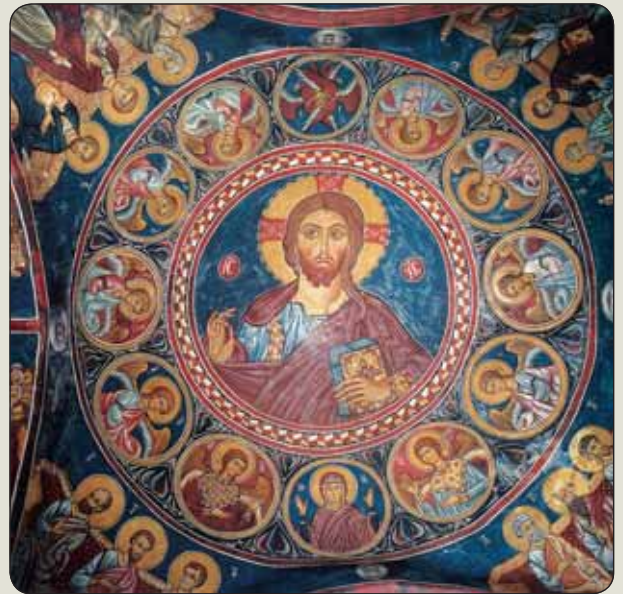
Pantokrator, Matka Božia, anjeli a 12 apoštolov z kostola Panagia Phorvotissa (Asinou) v cyperskej dedine Nikitari (1332)