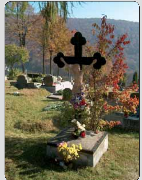
Pohľad na cintorín. Čučma, okres Rožňava