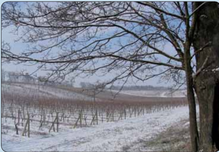
Vinohrady tvoria jeden z hlavných prvkov súčasnej krajinej štruktúry

formujúcich jednotlivé územia. Tento cieľ možno zabezpečiť podobne ako predchádzajúci najmä ekologizáciou a humanizáciou nadstavbovej sféry, najmä súčinnosťou ekonomických, legislatívnych nástrojov a humanizáciou spoločenského vedomia; ochrana proti prejavu prírodných rizík a hazardov – snahou tohto cieľa je ochrana pred povodňami, suchom spojeným s nadmerným odtokom vody z povodia, ochrana voči prejavu geodynamických procesov