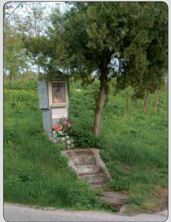
Božia muka v Kameníne, okres Nové Zámky

Keďže sa malým sakrálnym pamiatkam v našom regióne pred rokom 1989 prakticky nevenovala patričná pozornosť, ich dnešný stav je značne deprimujúci. Sme však presvedčení, že uchovanie tejto skupiny pamiatok s veľkou historickou hodnotou by malo byť dôležité rovnako pre veriacich, ako aj pre neveriacich, pretože sú súčasťou nášho spoločného kultúrneho de-