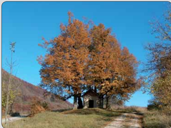
Prícestná kaplnka v Börke, okres Rožňava