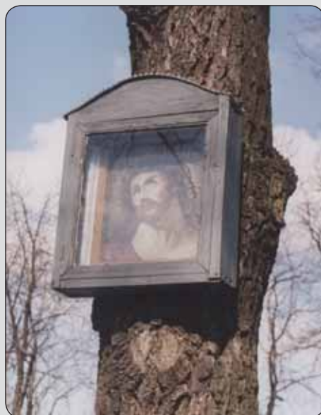
Obrazová skrinka na strome. Strekov, okres Nové Zámky

Ak by sme sa pokúsili o typologické vymedzenie spomínaných objektov, mohli by sme konštatovať, že do tejto kategórie patrí každý v teréne umiestnený objekt sakrálného charakteru, počnúc olejotlačovými obrázkami pripevnenými na živých stromoch, krížmi, malými obrazovými skrinkami cez širokú škálu Božích múk a prícestných krížov až po kaplnky, kalvárie a sochy jednotlivých svätých, ako aj Ježiša Krista, Panny Márie či Svätej Trojice. Autori niektorých sôch, prícestných kamenných krížov boli zjavne zruční majstri svojho remesla, na iných objektoch (napr. naivných vyobrazeniach sedliakov) zbadáť skôr lásku, ktorou niekdajší autori dokázali nahradiť chýbajúcu zručnosť. Keďže Výskumné centrum európskej etnológie sa zaujíma oveľa viac o kultúrnohistorickú hodnotu daných objektov, než o ich umeleckú alebo muzeálnu hodnotu, v záujme dosiahnutia úplnosti dokumentujeme všetky malé pamiatky. Takto sa v našom archíve nachádzajú i údaje o niekoľkých sakrálnych pamiatkach, o ktorých vieme, kto a kedy ich dal odhaliť, často o nich máme