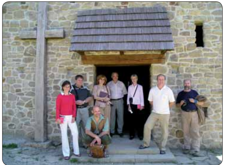
Jedno z mnohých pracovných česko-slovenských stretnutí, konkrétne v obci Modrá na Morave

Naším zásadným postojom pri implementácii dohovoru na Slovensku je získať pre spoluprácu všetky subjekty pracujúce s krajinou. V minulom roku sa nám podarilo začať spolupracovať s expertmi Prírodovedeckej fakulty Univerzity Komenského v Bratislave, Technickej univerzity vo Zvolene, Ústavu krajinné ekológie SAV v Bratislave, Slovenskej asociácie pre krajinnú ekológiu (ktorá je regionálnou organizáciou Medzinárodnej asociácie pre krajinnú ekológiu), Slovenskej komory architektov, Spoločnosti pre záhradnú a krajinnú