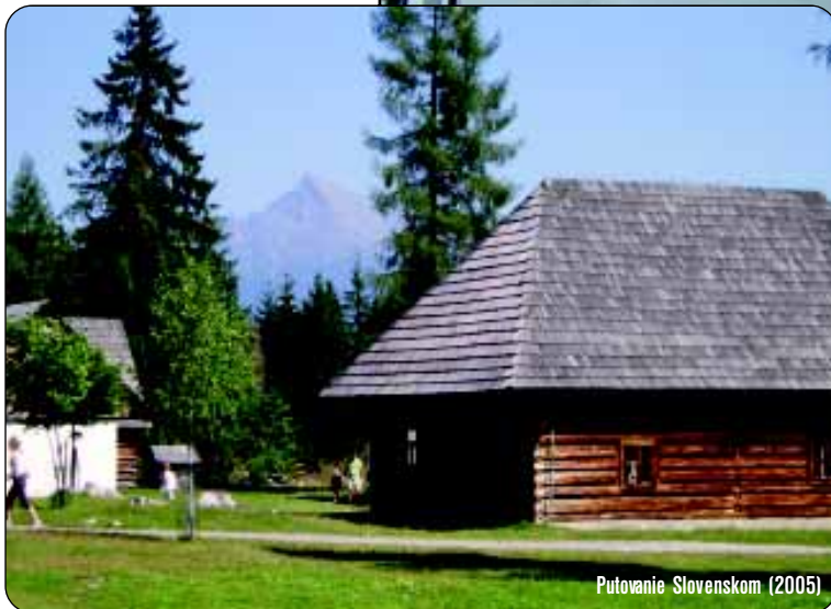
Putovanie Slovenskom (2005)

zdajú kruté a pre nás neprijateľné. My sa snažíme im vnútiť naše chápanie sveta, ale to ich im v džungli pomohlo prežiť po tisícročia. Keby nám niekto vnútil svoje tradície, mnohé by sa rozpadlo. Nevie si vôbec predstaviť, že by niekto prišiel a chcel pred naším domom postaviť mešitu. Zakázal by Vianoce a veľkonočné sviatky. Presťali by sme sa cez sviatky navštevovať, dávať si darčeky, nespoznali by sme tú nádhernú atmosféru pri vianočnom stromčeku. Naš život by bol prázdnější... Tak