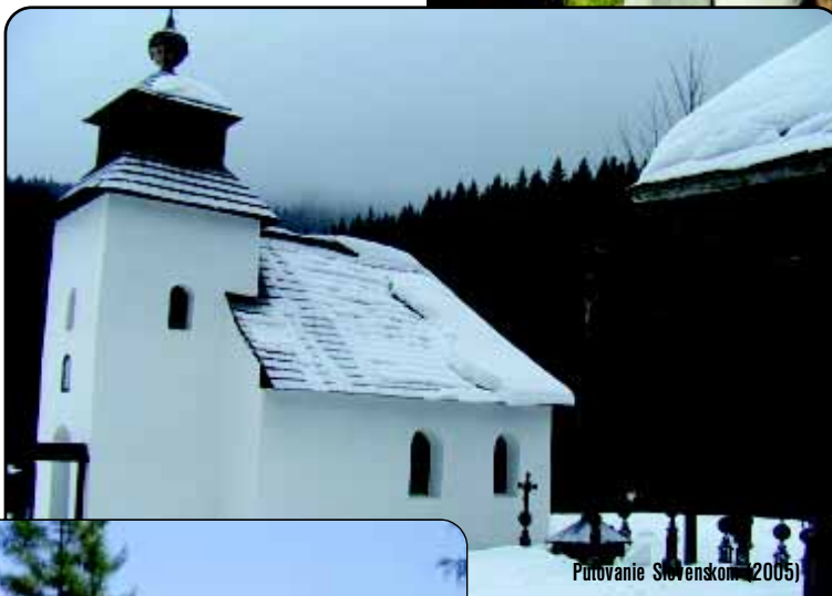
Putovanie Slovenskom (2005)