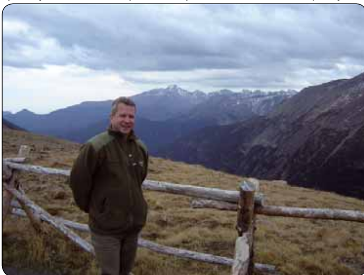
Svet alpínskej tundry z Trail Ridge Road, v pozadí najvyšší vrchol Longs Peak