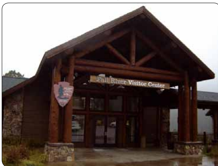
Jedno z 5 návštevníckych centier v národnom parku (Fall River)

vody z juhozápadnej časti do severovýchodnej časti územia národného parku. V národnom parku nie je žiadne trvalé osídlenie ani lyžiarske stredisko. Národný park spadá kompetenčne pod rezort vnútra. Pracovníci správy národného parku majú v krajine úctu, ľudia si vážia ich prácu v prospech prírody a sú aj náležité ohodnotení, čo sa týka vo všeobecnosti takmer všetkých štátnych zamestnancov v USA. Národný park kladie dôraz na výbornú informovanosť návštevníkov pri vstupe do národného parku (informačné brožúry a letáky, sezónne noviny). Inšpirujúce bolo aj masívne zapojenie dobrovoľníkov takmer vo všetkých oblastiach (od strážnej služby až po výskum), podpora sponzorov (jedným z veľkých je Ford Motor Company), pravidelné zhodnotenie efektivity manažmentu národného parku, umožnenie spätnej väzby návštevníkom národného parku o ich zážit-