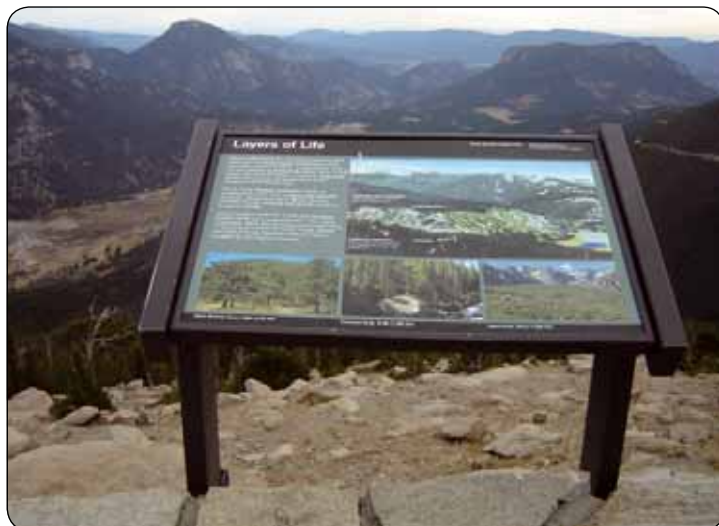
Dôraz sa kladie na informovanosť návštevníkov

Ing. Juraj Švajda Správa TANAP-u Tatranská Štrba