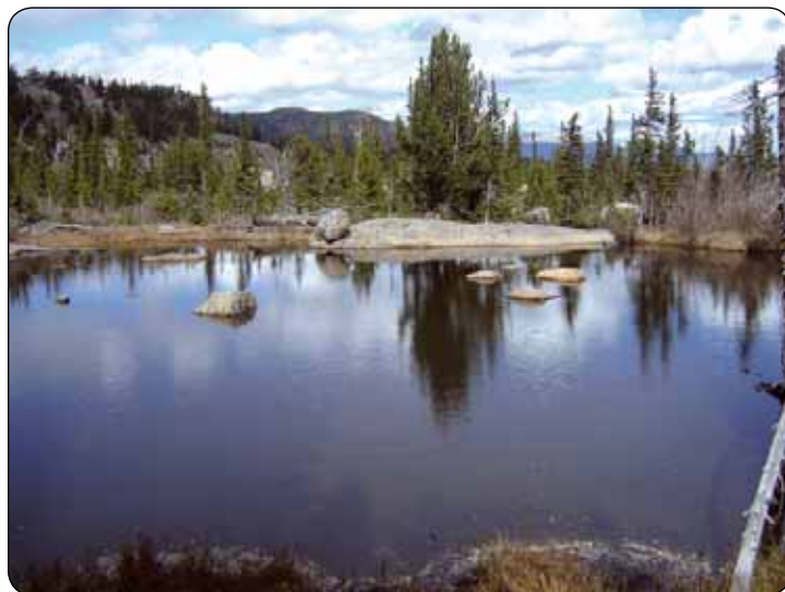
Pre prírodné prostredie národného parku sú typické ľadovcové horské jazerá

odstaviť automobil v nižšie položených parkoviskách. Služba je zriadená na základe koncesie a samozrejmosťou je, že v shuttle-buse dostanete základné informácie o národnom parku a možnostiach turistiky. Zaujímavá je aj snaha správy amerických národných parkov (national park service) čo najviac odbúrať byrokraciu. Počas našej návštevy sme mali pocit, že pracovníci národného parku sa naozaj v maximálnej miere venujú činnosti v teréne, nechýba vnútorná disciplína, zodpovednosť a najmä ústretovosť vo vzťahu k návštevníkom parku. O úrovni vzťahu