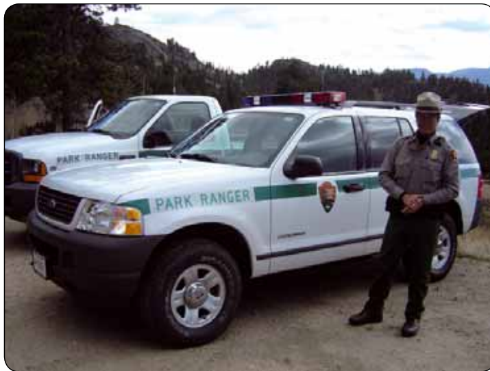
Typický protective ranger národného parku Rocky Mountain

poskytujú okolité mestá Estes Park a okolie Grand Lake. Časť parku je prístupná 3 cestami - jednou z najkrajších je 77 km dlhá Trial Ridge Road, ktorá na najvyššom mieste dosahuje 3 713 m n. m.. Vjazd je spoplatnený 20 dolármi a v priebehu zimy je horná časť uzatvorená. Výber vstupného sa realizuje na 4 hlavných vstupoch do národného parku. Príjem zo vstupného do národného parku slúži pre potreby údržby a servisu infraštruktúry (chodníky, cesty, toalety), resp. pre iné národné parky. Sieť turistických chodníkov má celkovú dĺžku 571 km. Zo športových aktivít je v národnom parku na určitých miestach možná jazda na koňoch, kempovanie v sieti kempingov na základe úradného povolenia, rybolov, horolezectvo a zo zimných aktivít lyžovanie, populárne sú v poslednej dobe aj snežnice a lyžiarska turistika. Poľovníctvo, kŕmenie živočíchov, zber a trhanie rastlín, cyklistika mimo ciest a vstup so psom na turistické chodníky sú zakázané. Cieľom národného parku je zachovať územie ako neporušený prírodný ostrov pre potešenie dnešným a budúcim generáciám.