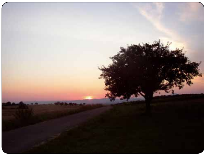
Cesta do „Chudobovej krajiny“

Aj v Chudobovom diele, podobne ako v celej lyrizovanej