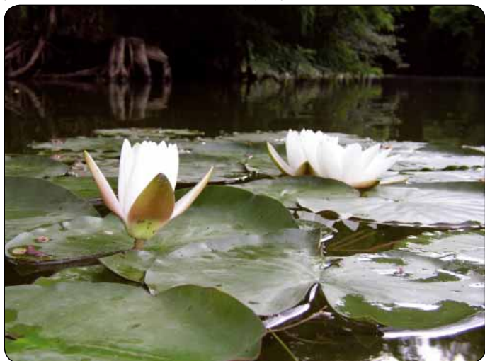
Mokrade neodmysliteľne patria ku koloritu „Chudobovej krajiny“

Opisy krajiny a prírody iba umocňujú Chudobovo krehké a citlivé lyrické videnie a ladenie príbehov. Nestoja v centre autorovho záujmu, len jemne, nenásilne, no čitateľsky mimoriadne pôsobivo dotvárajú komplex- nosť jeho celého zmyslového vnemu, ktorým umožňuje čitateľovi názornejšie precítenie a vnímanie kľúčových opisov ľudských osudov, ľudského šťastia i nešťastia, smerujúcich k pochopeniu posolstva človečenstva. Chudoba sa pritom javí ako mimoriadne vnímavý a dôsledný pozo- rovateľ južanskej krajiny a jej prírody. Jej rozličnými, no prítom charakteristickými a verne zobrazenými podoba-