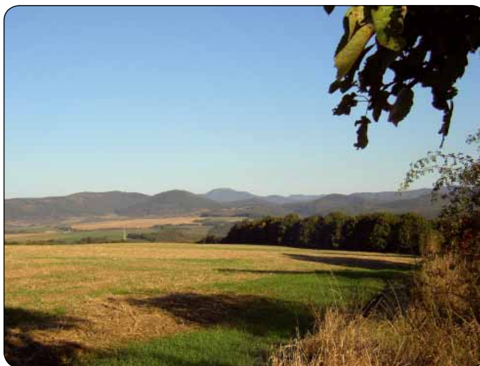
Krajina Chudobových príbehov

„Zastavili sme sa na niekoľkých miestach. Zavše som pootvoril oči a videl som snečnice, sušiarne a komín s bocianím hniezdom. Potom sme vošli medzi kopce, po stranách utekali vinič- né komory, broskyne a žlté koly. Chodníky medzi viničami ma celkom prebrali z driemot. Orechy, čerešne a vápencové kamene vyžarovali povedo- mé mesačné svetlo. Cítil som sen, červený prach a ženu v čiernom. Za agátovým lesom široké pole stúpalo