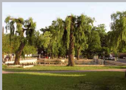
Centrálny priestor obce Kamiem Slaski