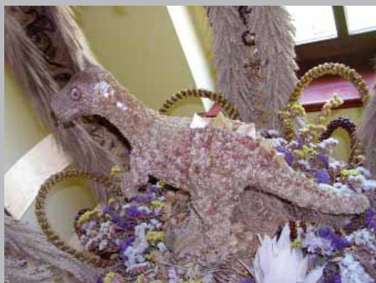
Motív dinosaura netradične v dožinkovom venci

programami revitalizácie týchto obrovských území – postupne sa jamy po povrchovej ťažbe hnedého uhlia zatápajú, čím vznikajú nové, umelé jazerá a v ich okolí sa vytvárajú športové a oddychové centrá. Len v súčasnosti je v tejto oblasti 15 takýchto umelých jazier o celkovej ploche okolo 7 000 hektárov. Úplné zatopenie povrchových jam sa plánuje až do roku 2015. Nové jazerá budú navzájom pospájané kanálmi, po ktorých sa budú môcť plaviť lode.