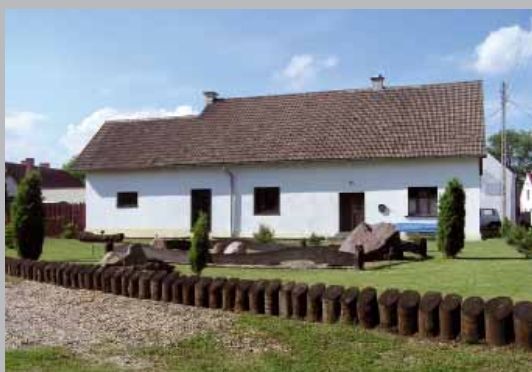
Zmenšené ploty – otvorenie priestorov