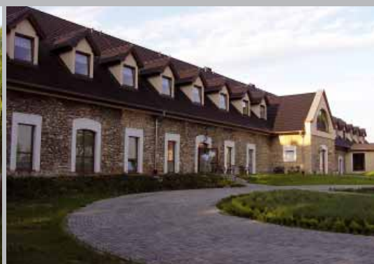
Zo starých hospodárskych budov vytvorili liečebné centrum