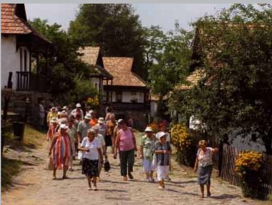
Cez deň je Hollókő plný turistov...