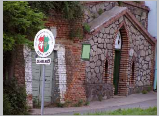
Pri potulkách republikou a jej vinnými pivničkami môžete zabúdiť aj do zahraničia

a založila obranný pakt MATO (Moravská asociace týlové obrany). Z recesistických akcií bola najväčšou tzv. Antireferendum na brnenskom námestí, ktoré sa konalo 22. 2. 2002 o 2. hodine 22. minúte a 22. sekunde poobede. „Demonštranti“ žiadali zastavenie Viedenského obrieho kola v Prátri, pretože ženie mráz z Viedne na moravské vinice. Motív a myšlienka Slobodnej republiky Kraví Hora sa nesie celou dedinkou, je výborným spôsobom ako propagovať a prezentovať svoju obec, jej možnosti a pozoruhodnosti. Kraví Hory neznamenajú pre obyvateľov len malú dedinku vinných pivničiek a celoročnú drinu vo vinohradoch, ale sú miestom odpočinku, častých osláv a stretnutí pri cimbale. Obec v roku 2005 zvíťazila v súťaži Vesnice roku 2005 v Programe obnovy dediny.