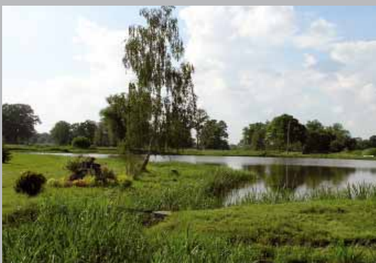
Harmónia kultúrnej a prírodnej krajiny