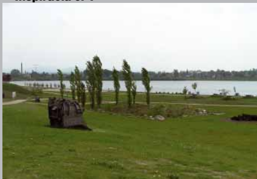
Novovytvorené prostredie jazier môže umelecky dotvárať aj vyradená banská technika