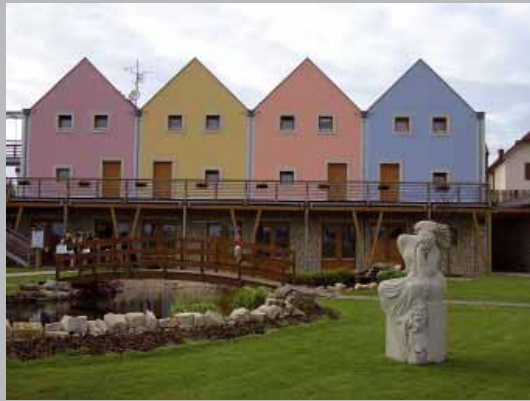
Netradičný hotel je vstupnou bránou do „Slobodnej republiky Kraví Hora“