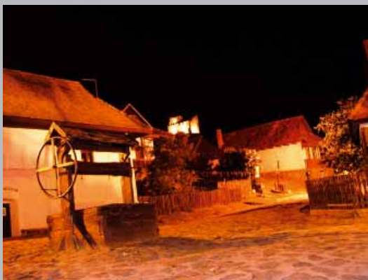
... ale po zotmení v ňom život zastane