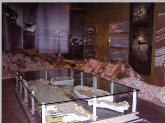
Pohľad na expozíciu v budove školy