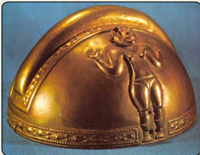
Prilba z tumbagy (Quimbayský poklad)