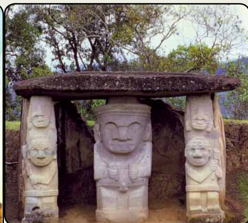
Sochy zo San Agustina