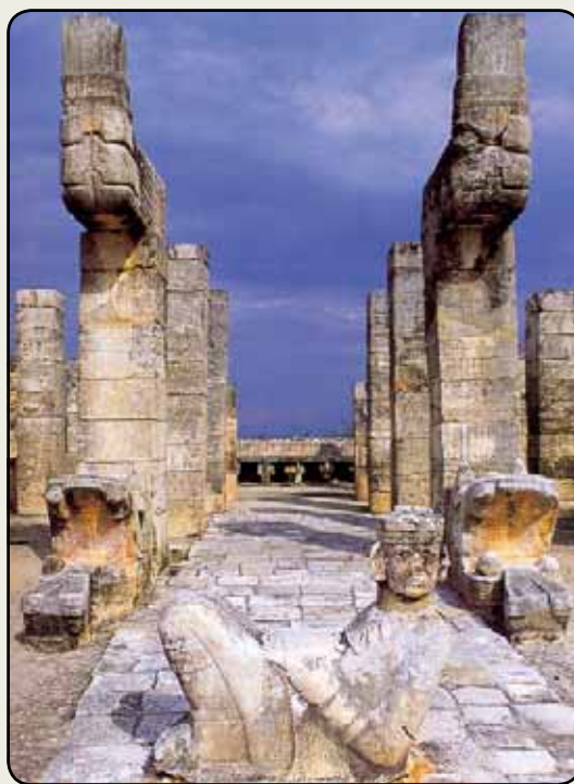
Boh dažďa Chac Mool zo Chichén Itzá