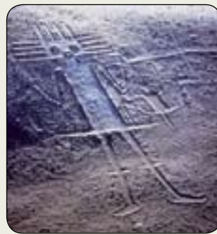
Geoglyfo Gigante De Tarapaca (Chile)