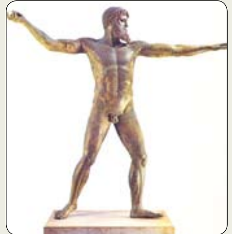
Poseidón (Archeologické múzeum v Aténach)

rých atlantológov značne pripomína tri vrchy azorských ostrovov - krajný Caldeira (1 043 m n. m.) na ostrove Faial, stredný Pico Alto (2 351 m n. m.) na ostrove Pico a tretí Santa Bárbara (1 021 m n. m.) na ostrove Terceira, ktoré pri nižšej hladine oceánu by spojito výrazne vyčnievali nad ňu. Trojvršie (trojzubec?) sa objavuje aj ako znak alebo písmeno v písmach Mezopotámie, Egypta, Ugaritu, Číny, Japonska, Fenície, ale aj v hebrejčine a azbuke. Starí Egypťania pritom svoje hieroglyfy považovali za odniekiaľ privezené písmo bohov, ktoré sa naučili používať. Medzi najväčšie geoglyfy/terraglyfy patrí 128 m dlhý trojzubec Candelabro de Paracas v Peru. Harpúna symbolizovala aj Mesentiuv/Harpunárov, ktorí sa pripravili do delty Nilu koncom 4. tisícročia prnl. spolu s Nasledovníkmi Hóra/Smsu-Hr, vyznavačov jedného snečného boha Atona (s mocenskou obnovou tohto kultu Achnatonom v rokoch 1379 - 1362 prnl.) a zakladateľov Onu - mesta snečného boha (aj Aztékovia svojho snečného boha v strede kamenného kalendára nazývali Aton-at-íh).