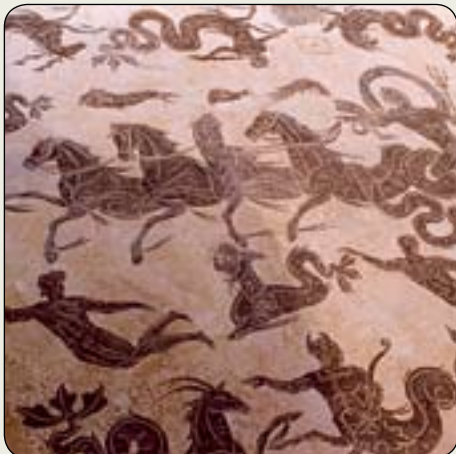
Mozaika v kúpeľoch s Poseidónovou kvadrigou v Ostii (Taliansko)

Platón v dialógu Kritiás o Atlanťanoch uviedol: „Po mnoho pokolení, pokiaľ v nich pôsobila božská prirodzenosť, boli poslušní zákonom a správali sa priateľsky k rovnorodému božskému plemenu; zmýšľali spravodlivo a ušľachtilo, správajúc sa v osude každého i spoločne medzi sebou mierne a s rozumom. Preto všetko, okrem mravnej a telesnej dokonalosti, málo si cenili pozemské statky a ľahostajne, skôr ako bremeno, niesli množstvo svojho zlata i ostatného majetku. Neopájali sa rozmarnosťou, ani neupadali do chýb, strácajúc pre bohatstvo vládu nad sebou samými.“ Podľa Kritia v Atlantide dvakrát do roka zbierali úrodu, využívali neznáme plodiny (napríklad