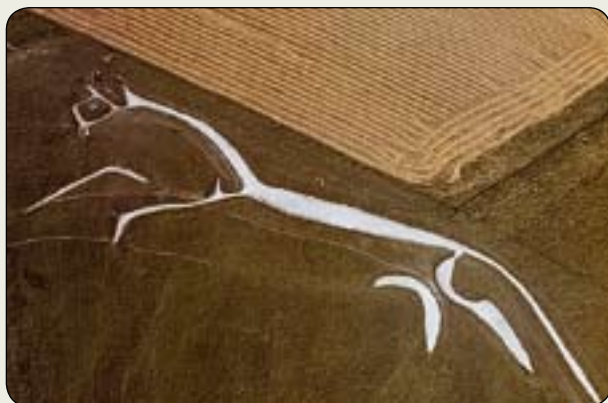
White Horse z Uffingtonu (Anglicko)

(Slová Veľkého ducha k Indiánom v Minnesote)