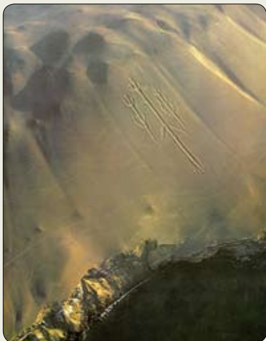
Candelabro de Paracas (Peru)