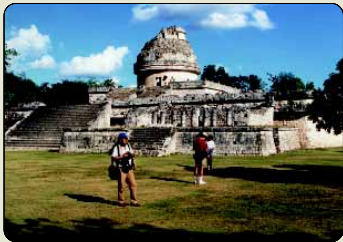
Mayské observatórium Stimači dom/El Caracol v Chichén Itzá