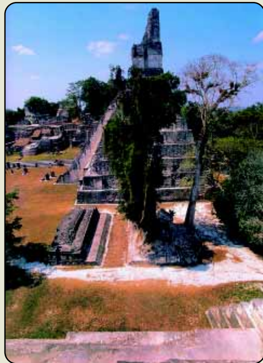
Pyramídy v Tikale

a jeho syna Sky Xula (785 - 795), objavených vedcami Pensylvánskej univerzity. Najväčšia E z roku 771 dosahuje výšku 10,6 m, šírku 2,7 m, hrúbku 1,25 m a hmotnosť 65 t. Ďalšie stély a bloky v pobrežných močiaroch tiež dosahujú hmotnosť 50 - 60 ton. Väčšina pochádza z rokov 750 - 810 n. l. Viaceré bloky upravili do tvaru žaby, korytnačky, hada a jaguára. Pri Riu Usumacinta odkryli väčšie mayské sídlo Altar de Sacrificios.