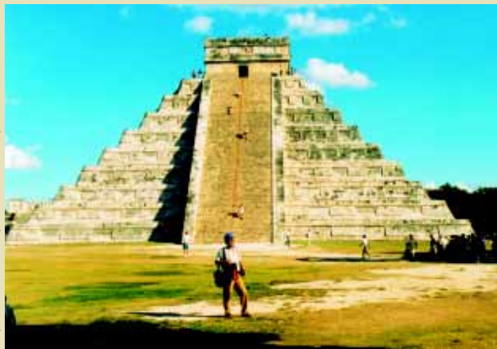
Maysko-toltécka pyramída El Castillo v Chichén Itzá