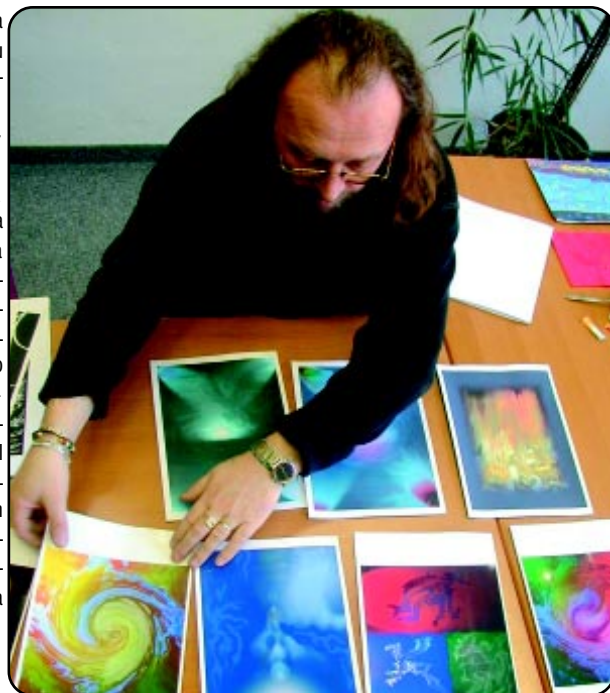
Nad kresbami detí v Zelenom svete 2002