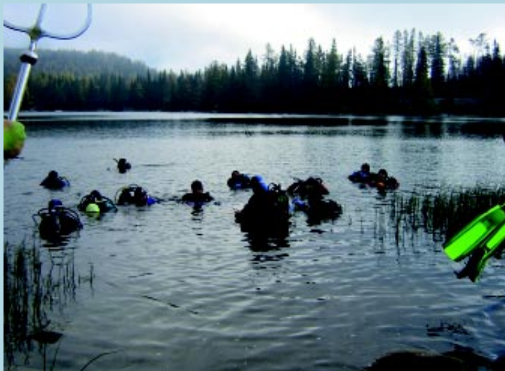
Počas dvoch festivalových dní potápači čistili Štrbské pleso, Velické pleso, Popradské pleso a Nové Štrbské pleso. Vyzbierali spolu 345 kg odpadu. Už tradične najväčší objem tvorili plastové poháriky, fľaše a našli sa aj dva hrnce