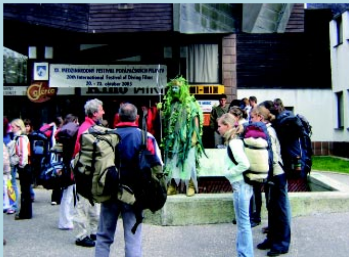
Do kina v Tatranskej Lomnici, kde sa premietali filmy určené detskej porote, sa „zatúlali“ aj gymnazisti zo Sabinova, ktorí v čase konania festivalu zdolávali tatranské štíty