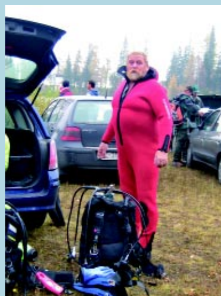
Medzi potápačmi na Štrbskom plese nechýbal ani hosť festivalu, potápačská legenda a hľadač pokladov Gerhard Zauner z Rakúska