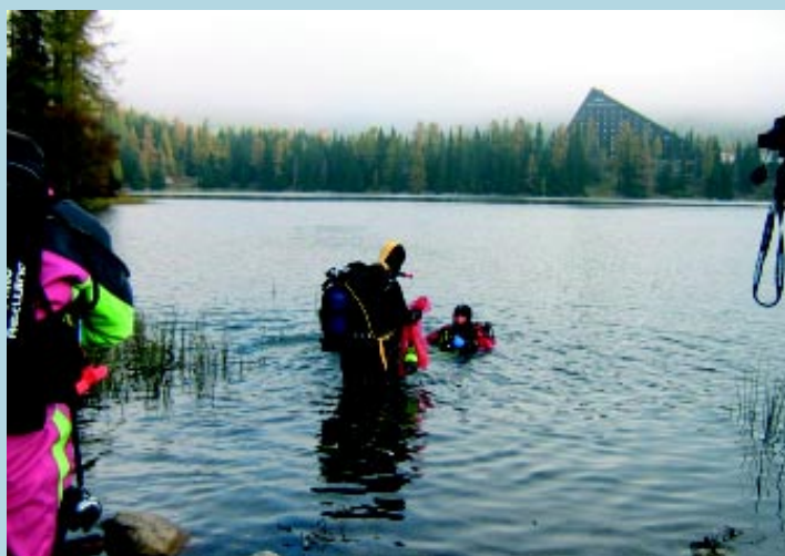
Druhý deň akcie sa potápači zrúna ponárali do Štrbského plesa za asistencie hmly. Tá sa však za chvíľu zdvihla, odhalila zasnežené tatranské štíty a pod jubilejný dvadsiaty ročník sa podpísalo pekné slnečné počasie, ktoré, ako iste potvrdia pamätníci, je na tomto festivale skôr výnimkou ako pravidlom