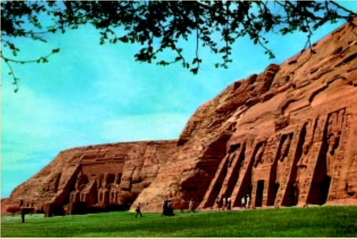
Veľký chrám a Malý chrám v Abu Símbel