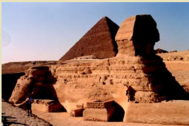
Veľká sfinga v Gize