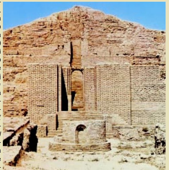
Zikkurat Choghá Zanbil