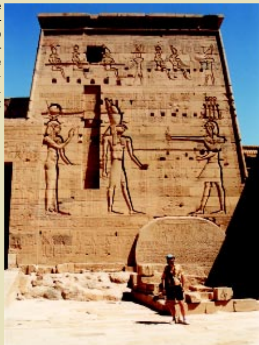
Zatopený pylón chrámu Isis na ostrove Philae prenesený na ostrov Agilka