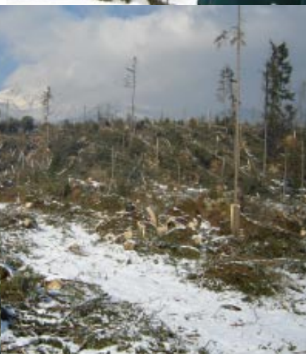
Cesta Štôla - V. Hágy

V našom prípade navrhnutá zonácia znamená vytvoriť okolo 50 až 55 percent zóny „A“. Pokiaľ by sme sa dohodli a spoločnosť to bude akceptovať, nemalo by dôjsť k žiadnej zmene národného parku na lunapark. V súčasnosti samotní podnikatelia, špeciálne i mesto Vysoké Tatry a, samozrejme, ľudia, ktorí tu žijú, si dostatočne uvedomujú, že si nemôžu nijako zničiť predmet svojho záujmu a životia. Druhou stranou mince je otázka záujmu ľudí