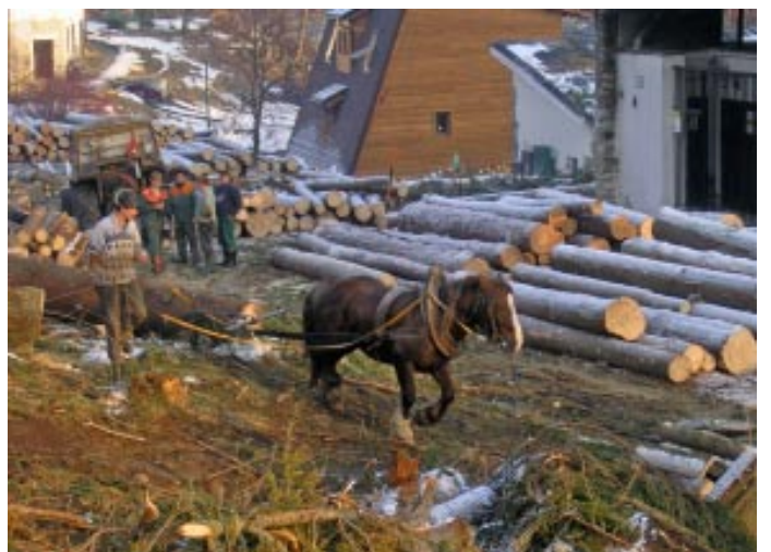
Za hotelom Palace

zonáciu, dohodnúť sa na tom, že si vytvoríme územie, kde nebudeme do prírody nijako zasahovať. Zároveň je však potrebné vyhradiť aj priestor pre cestovný ruch, nenáročný na kapacitu, ale s dôrazom na kvalitu, ktorý by zodpovedal tomu, že sa nachádza v špičkovom území. Vysoké Tatry by mali zostať ako jedno excelentné územie, kde návštevníci vedia nájsť čo hľadajú, vrátane neporušenej prírody.