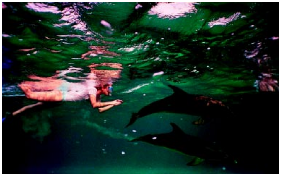
Najsilnejším zážitkom bolo plávanie s delfínmi

Trochu som sa bála, že nevyrovnam tlak. Ešte na potápačskom kurze sa mi toto raz