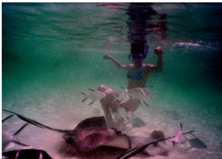
Romantika nad vodou i pod vodou - to je zátoka s romantickým názvom Honeymoon Harbour plná raj

Nie, medzipristátie a prestávku sme mali v Madride.