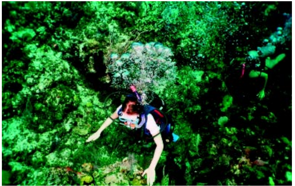
Pod vodou Janka uvidela a zažila viac ako si vysnívala

Ostrov Bimini sú súčasťou Bahamskej republiky, súostrovie zložené zo sedemsto ostrovov. Sú to dva malé ostrovčeky, uložené v oceáne v podobe úzkeho pásu. Severné Bimini majú na niektorých miestach šírku 20 metrov, niekde sto a dlhé sú štyri, päť kilometrov. Južné Bimini sú trochu väčšie, je tam aj letisko pre malé lietadlá.