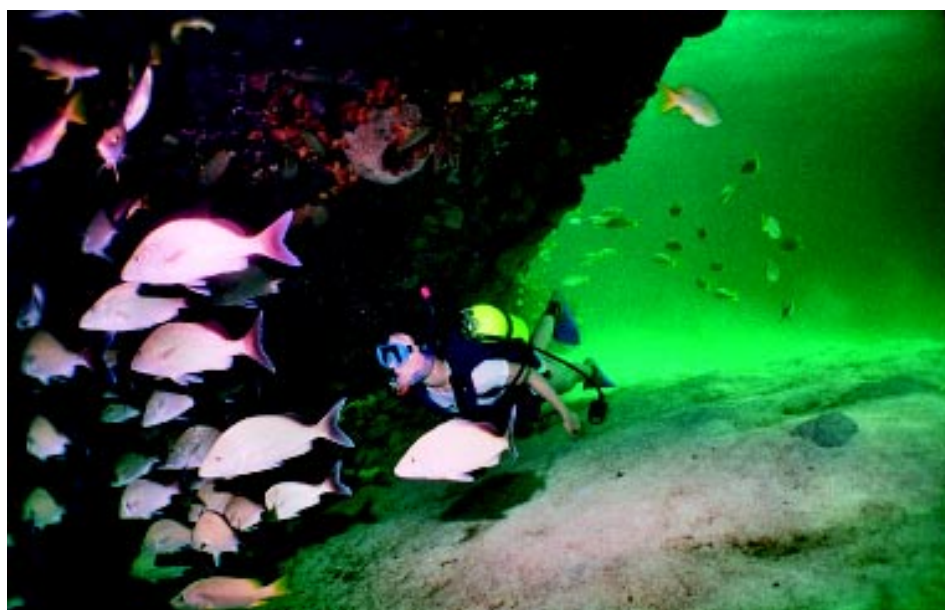
Potápanie pri vraku lode Hesperis